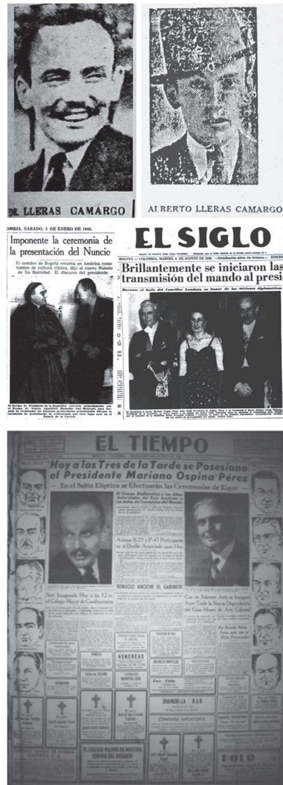
Fuente: Vanguardia Liberal (1944, 19 de julio, p. 1); El Diario (1937, 2 de marzo, p. 1); El Siglo (1946, 5 de enero, p. 1; 1945, 6 de julio, p. 1) y El Tiempo (1946, 7 de agosto, p. 1).