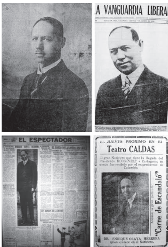
Figura 1. Enrique Olaya Herrera