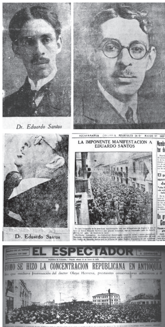
Figura 3. Eduardo Santos Montejo