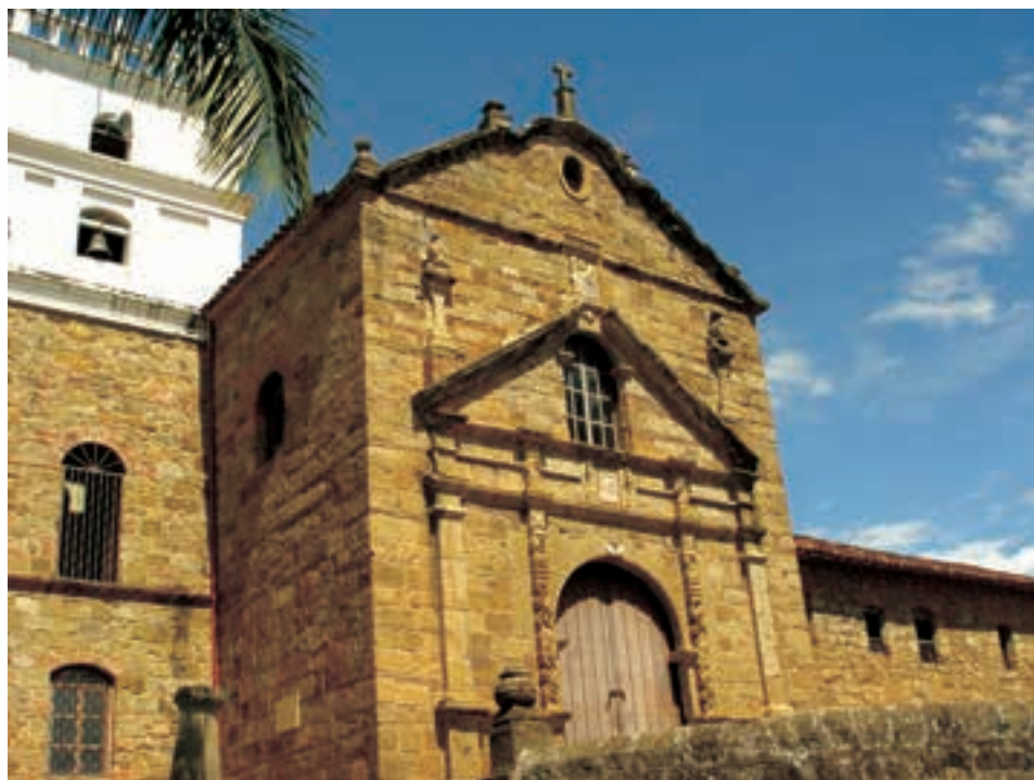
Imagen 2. Convento de San Juan Bautista e Iglesia de Santa Bárbara.

En la Villa del Socorro se gestaron los primeros brotes de libertad que dieron origen al proceso independentista, y en ella, el Convento de los Capuchinos actuó como escenario significativo.