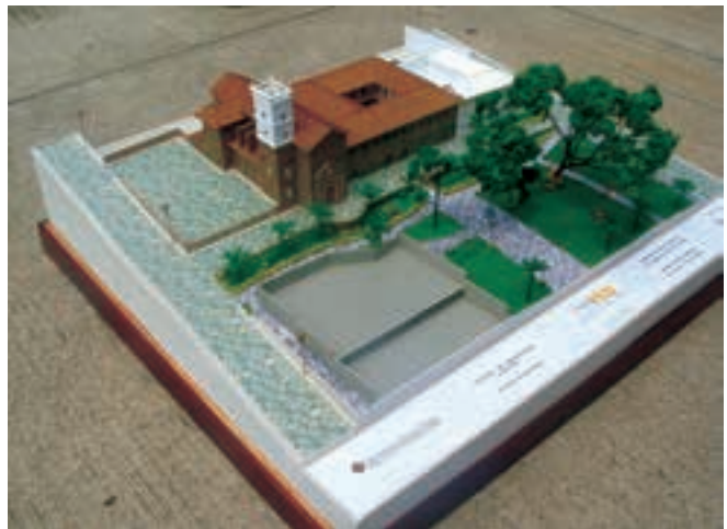
Imagen 5. Maqueta del Convento e Iglesia de los capuchinos en Socorro