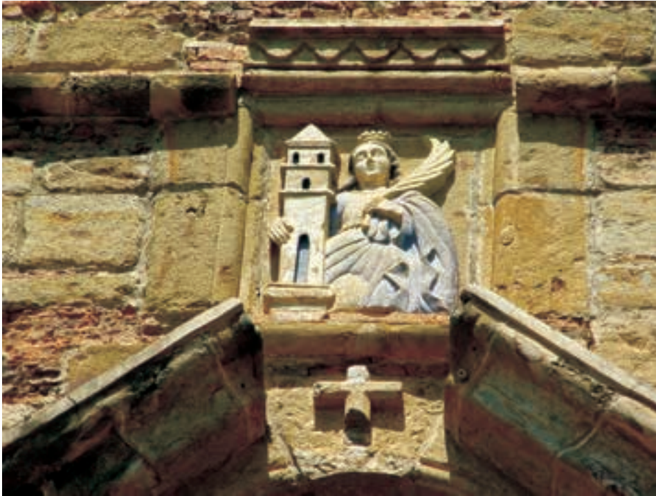
Imagen 3. Imagen de la Virgen de Santa Bárbara en la fachada de la iglesia