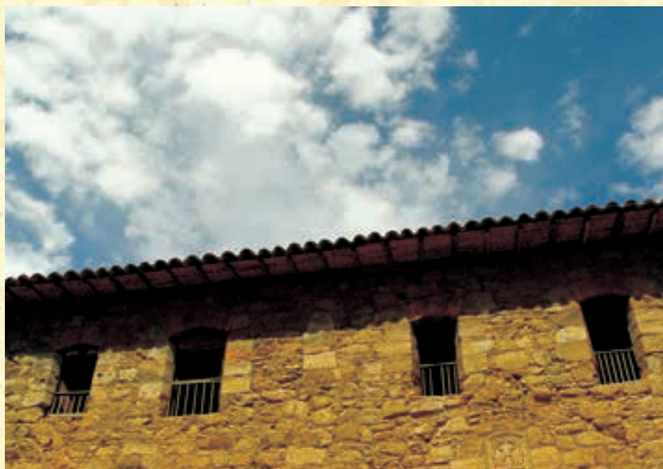
Imagen A. Vista del Convento de San Juan Bautista en el municipio de Socorro.