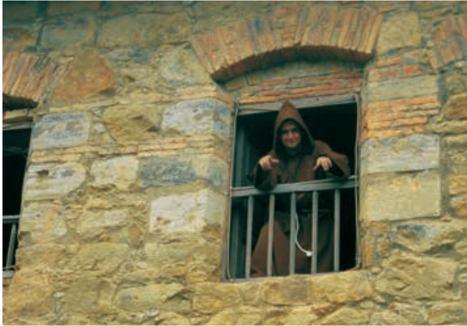
Imagen 6. Secciones de trabajo preparatorias del video Fuente: Fotografía tomada por los autores, 2010.