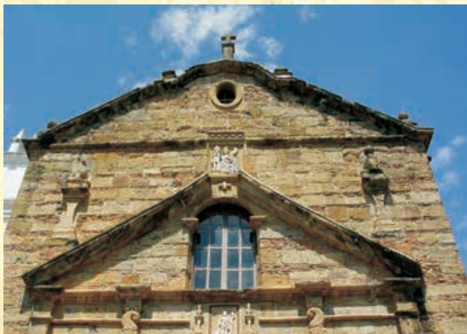
Imagen B. Detalle del segundo cuerpo de la portada de la Iglesia Santa Bárbara.

** Estudiantes que participaron en el proyecto. El proyecto contó con la colaboración de los arquitectos Nahir Pabón Castro y David Alberto Arias, y el Departamento Departamento de Comunicaciones de la Universidad Santo Tomás