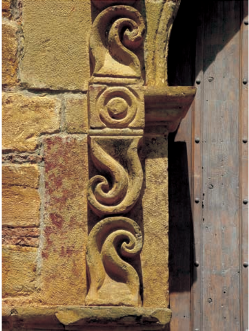
Imagen 4. Detalle de la portada en piedra de la Iglesia de Santa Bárbara