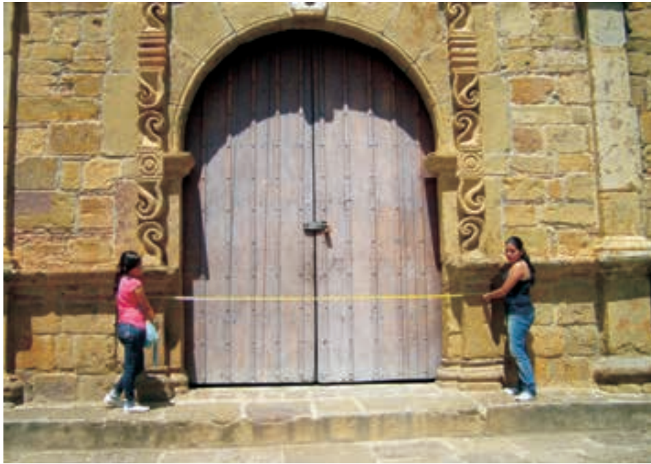
Imagen 1. Secciones de trabajo en la Iglesia de Santa Bárbara