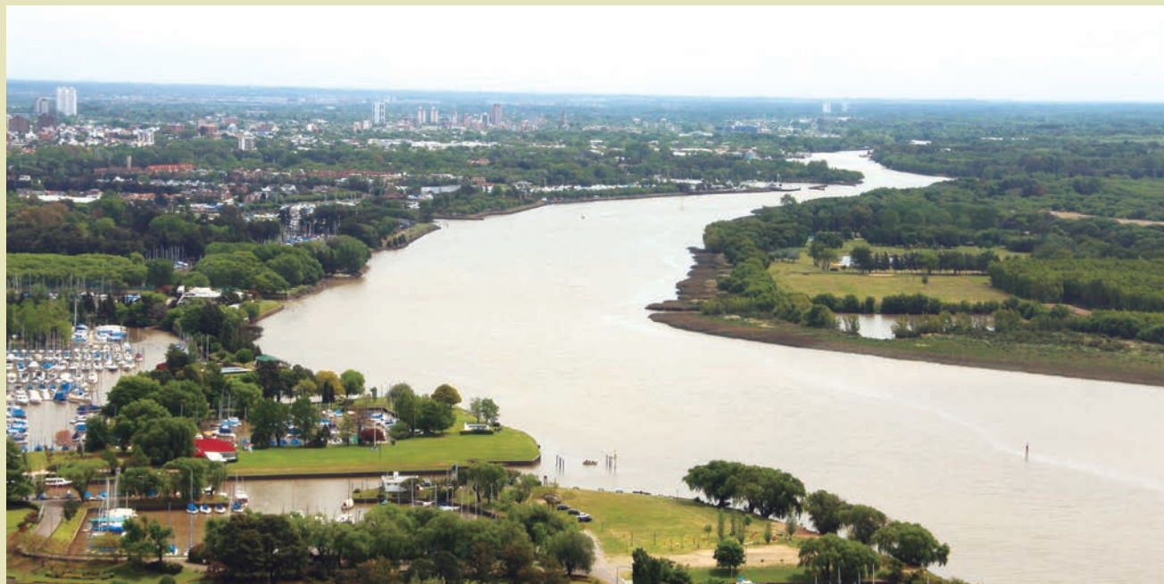
Avance del frente del delta inferior. Islas nuevas en formación