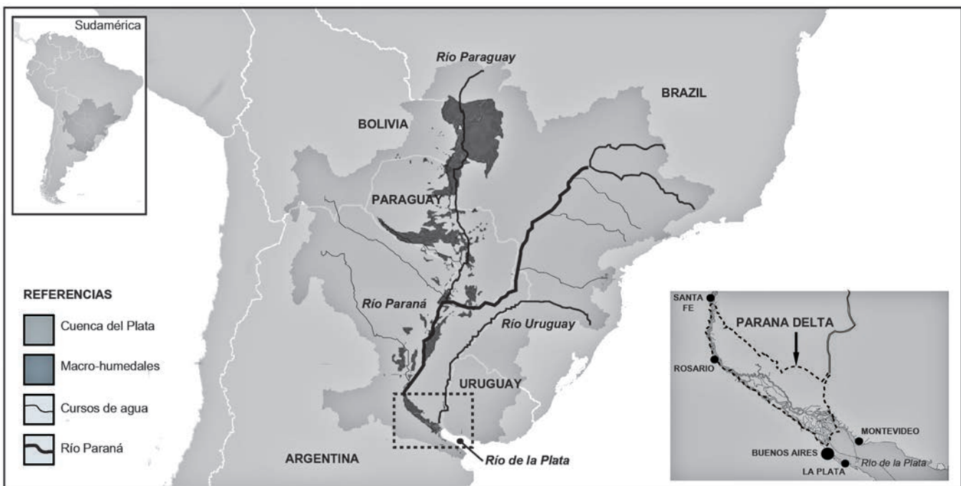
Figura 1. Ubicación del sistema de humedales del Delta del Paraná

A lo largo de sus 320 kilómetros de extensión, los humedales del Delta del Paraná (figura 1) presentan contrastes derivados de la diversidad y naturaleza de sus paisajes y de su relación con los patrones de ocupación. El entorno natural de las islas del Delta ha sido foco de numerosas intervenciones para la explotación de sus recursos naturales, mayormente relacionadas con actividades productivas como la ganadería o la forestación. Asimismo, su topografía ha sido alterada para los asentamientos humanos, aunque no se han desarrollado emprendimientos de alta densidad dentro del perímetro de las islas. Por el contrario, las áreas urbanas se han asentado frente a estas, a lo largo de las costas del río Paraná. Allí se encuentra una red de ciudades con diversas escalas de relevancia y especialización, entre las cuales se destacan cuatro grandes aglomeraciones urbanas: el Área Metropolitana de Buenos Aires (AMBA) –la conurbación más grande de Argentina, con una población de alrededor de 12 millones de habitantes (Indec, 2010)–, Rosario, la ciudad de La Plata y Santa Fe. Junto con otras ciudades de menor escala, estas aglomeraciones determinan el corredor económico más rico y poblado del país y convergen con la ruta comercial más relevante del Mercosur que conecta Santiago de Chile (Chile) con Sao Paulo (Brasil).