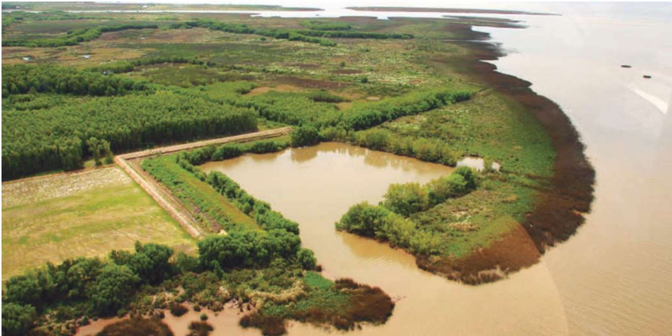
Figura 2. Avance del frente del Delta inferior. Islas nuevas en formación

El río Paraná presenta una descarga de 18 000 m 3 /seg y transporta alrededor de 160 millones ton/año de sedimentos (28% de arcillas, 56% de limos y 16% de arenas). La arena que se deposita sobre la desembocadura del río influye en el incremento de la longitud del Delta, mientras que los limos son los responsables del aumento de la cota, resultando en la emergencia de bancos que posteriormente se convierten en islas (Pittau et al., 2004). El avance del frente del delta o llanura subaérea producido por los aportes sedimentarios presenta una tasa de crecimiento lineal de 50 a 100 m por año para el subfrente del Paraná de las Palmas (localizado en el sector Sur, paralelo a las costas de la ciudad de Buenos Aires) y de 0 a 25 m por año para el subfrente del Paraná Guazú (ubicado al Norte, cercano a la desembocadura del río Uruguay). En función de esa tasa, se estima que el Delta avanzaría hasta llegar al límite de la ciudad de Buenos Aires en unos 110 años (Sarubbi et al., 2006; Pittau et al., 2004), produciendo una alteración en la morfología costera y un cambio en la relación entre las ciudades y el agua (figura 2).