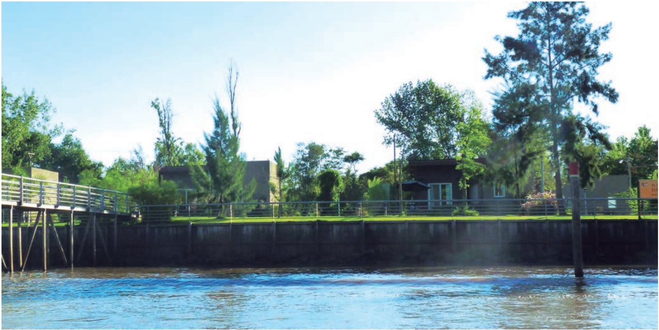
Figura 5. Complejos turísticos de cabañas en las islas

fía y la biodiversidad sino que también generan un movimiento de personas con niveles socioeconómicos y culturales diferentes al característico de la zona. Otro resultado del impacto de las nuevas dinámicas poblacionales, es la situación de contraste que tiene lugar entre la primera y segunda sección de islas, pertenecientes a los municipios de Tigre y San Fernando, respectivamente.