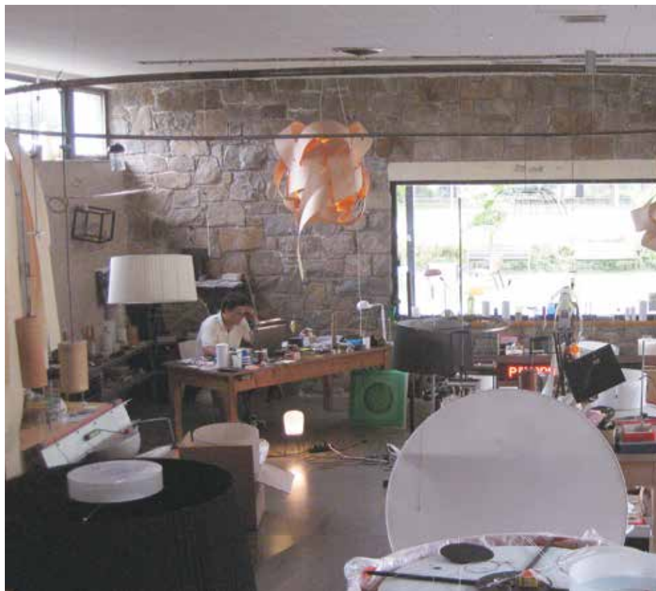
Figura 14. Aula del bloque femenino de la Escuela-Residencia de Bell-lloc transformada en taller de diseño de lámparas de Santa & Cole Fuente: Amaya Martínez (2011).