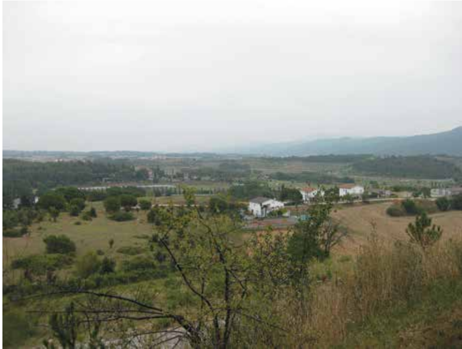
Figura 1. Vista panorámica hacia el entorno circundante desde el conjunto escolar en la actualidad

bajo los conceptos de la modernidad arquitectónica durante la década de los sesenta, fue seleccionado por su innovadora propuesta. Su situación urbanística en un entorno carente de preexistencias arquitectónicas en el momento de su ejecución, pero con gran valor natural, implica que el conjunto en sí mismo ha caracterizado el lugar, y por lo tanto, la memoria del mismo.