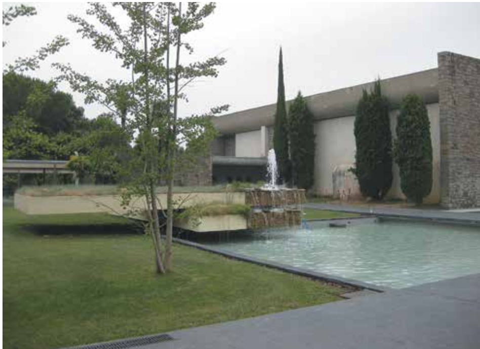
Figura 6. El área ajardinada con la fuente y la iglesia al fondo (1969)

En la ordenación urbanística toma una vital importancia la relación entre los volúmenes y el tratamiento dado a los espacios exteriores. Los caminos, cubiertos con un sistema de pérgolas, vinculan cada uno de los cuerpos aislados y dotan al conjunto de unidad a la vez que permite disponer de espacios de circulación independientes al paso a través de los edificios.