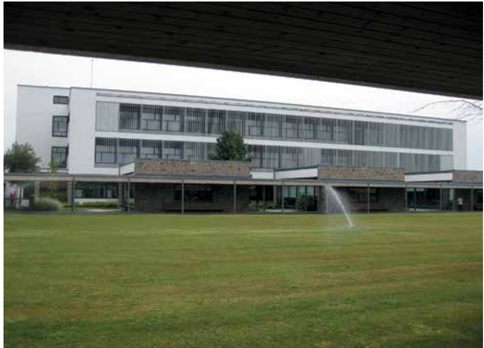
Figura 5. Vista actual de un patio de juegos, como área ajardinada y de exposición de los productos de Santa & Cole (2011)