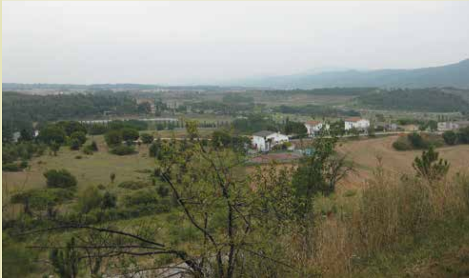
Vista desde la cubierta hacia la residencia y zona ampliada.