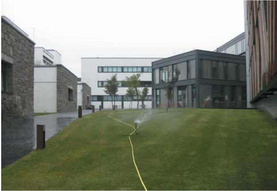
Figura 11. Fusión entre lo "Antiguo" y lo "Nuevo" tras la intervención