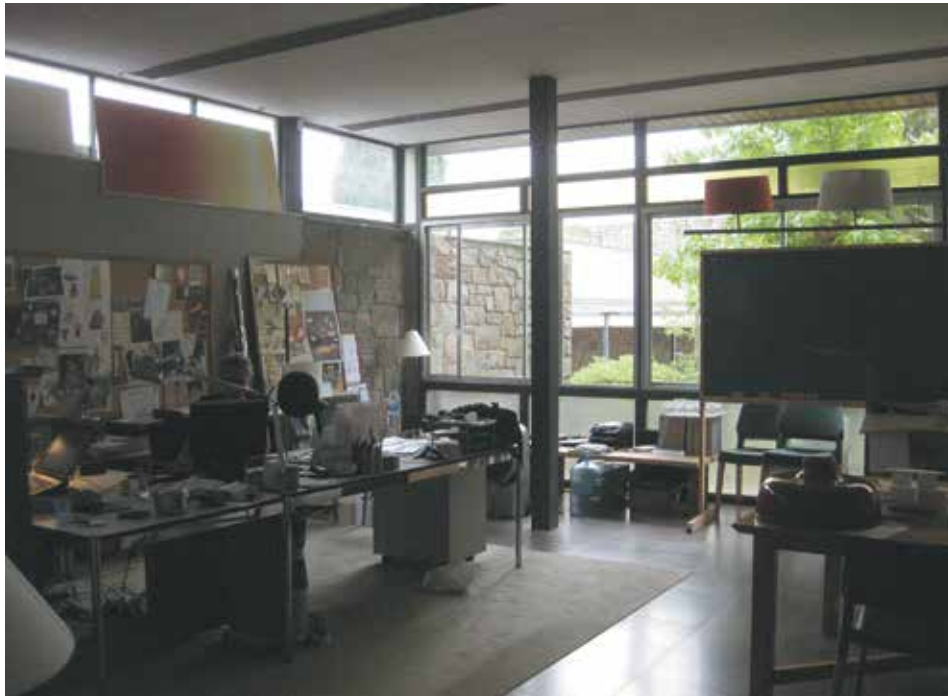
Figura 8. Interior de una de las aulas en la actualidad como áreas de diseño de Santa & Cole. Se destaca la espacialidad a través de su altura y su relación con el exterior a través de las grandes superficies de cerramiento y los diferentes sistemas de ventilación