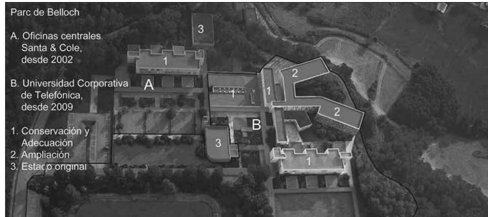
Figura 10. Vista aérea tras la reconversión, adecuación y ampliación de la Escuela-residencia de Bell-lloc Fuente: Batllé i Roig Arquitectes (2009), editada por la autora (2012).

En 2006, los arquitectos Batllé i Roig reciben el encargo, por parte de Parc de Belloch S.L., de desarrollar una intervención de mayor envergadura: la adecuación en el resto de los edificios del Campus para la Universidad Corporativa de Telefónica (UCT). Debido a la amplitud del programa, que contaba con 180 habitaciones, 20 aulas para seminarios, restaurante, cafetería y salones, se decide intervenir y adecuar tres de los edificios existentes: el comedor, el aula-residencia de alumnos y la residencia de profesores. Su extenso programa incluiría una ampliación destinada a acoger la nueva residencia y el acceso principal.