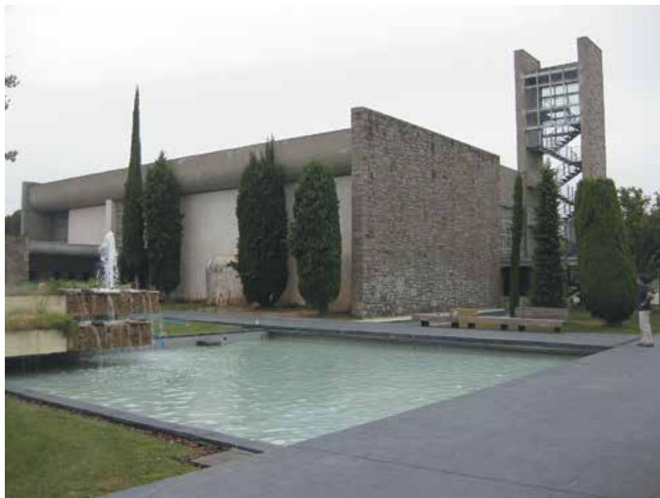
Figura 7. El área ajardinada y la iglesia con el cuerpo exento del campanario

Además de la descripción anterior, Baldrich, quién también diseñó parte del mobiliario, se supo rodear de diferentes artistas para incorporar las artes como parte de la experiencia del aprendizaje. Así encontramos elementos artísticos en la iglesia como las esculturas y las puertas de J. M. Subirachs, las vidrieras de R. Casariada y los mosaicos exteriores sobre los muros de piedra de A. Martí que permiten identificar los diversos patios.