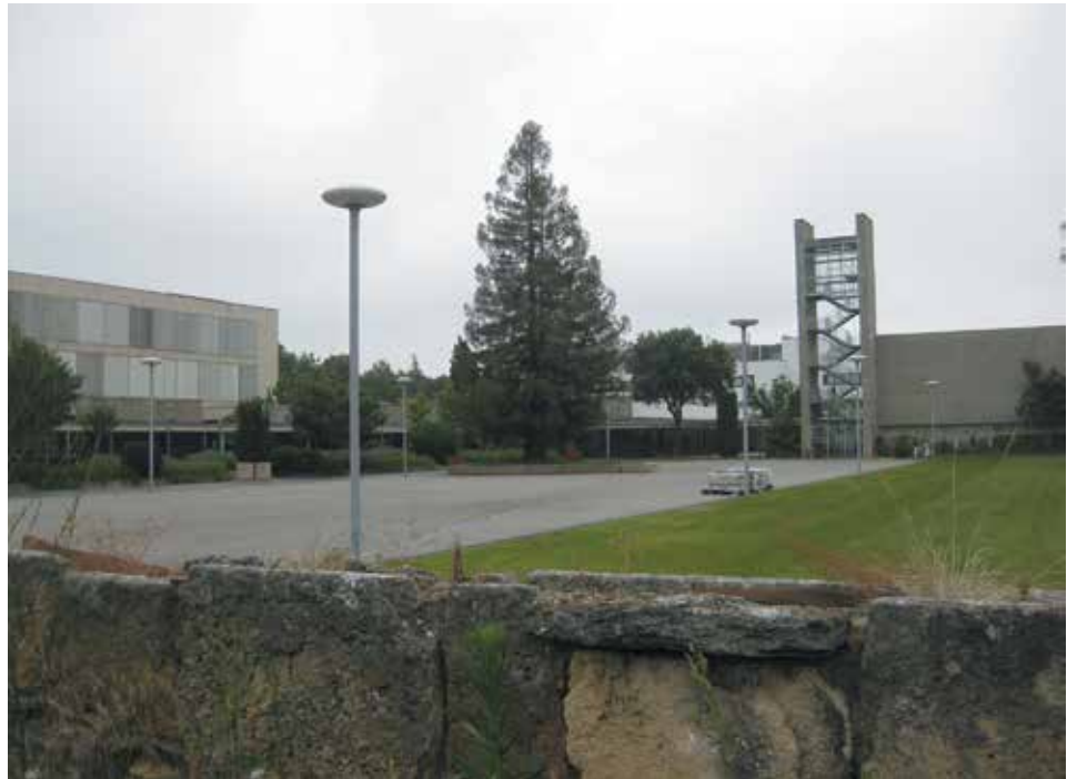
Figura 2b. Vista del complejo educativo en la actualidad