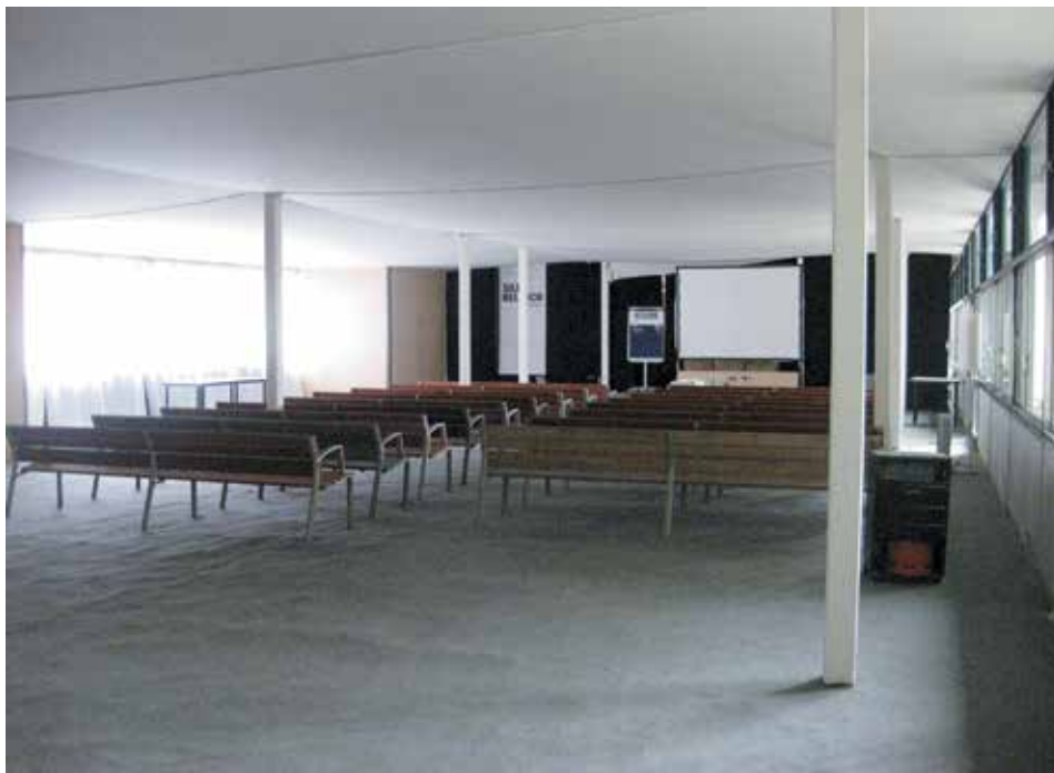
Figura 9. Interior de una de las salas de residencia adaptada como sala de conferencias en la actualidad, en la que se han eliminado las mamparas de separación. Se destaca su espacialidad y la resolución de la fachada con el diseño de la carpintería para permitir una óptima ventilación y los brise-soleis Fuente: Amaya Martínez (2011).

Parc de Belloch S.L. y Santa & Cole se instalan definitivamente en el edificio destinado a las aulas-residencias, en la parte más próxima al aparcamiento. Las intervenciones que se realizan se limitan a modificaciones interiores para la adaptación a sus necesidades concretas. La planta baja es ocupada por la recepción y con los talleres de diseño ubicados en las aulas orientadas a sur, conformadas entre los patios. Las aulas internas son utilizadas como espacios de exposición de sus productos mientras las que vuelcan al norte se mantienen aún vacías, a espera de recibir nuevos usos. En la primera planta, se mantienen los paneles divisorios de los dormitorios y se adecúa una sala de presentaciones. Además, se realiza un