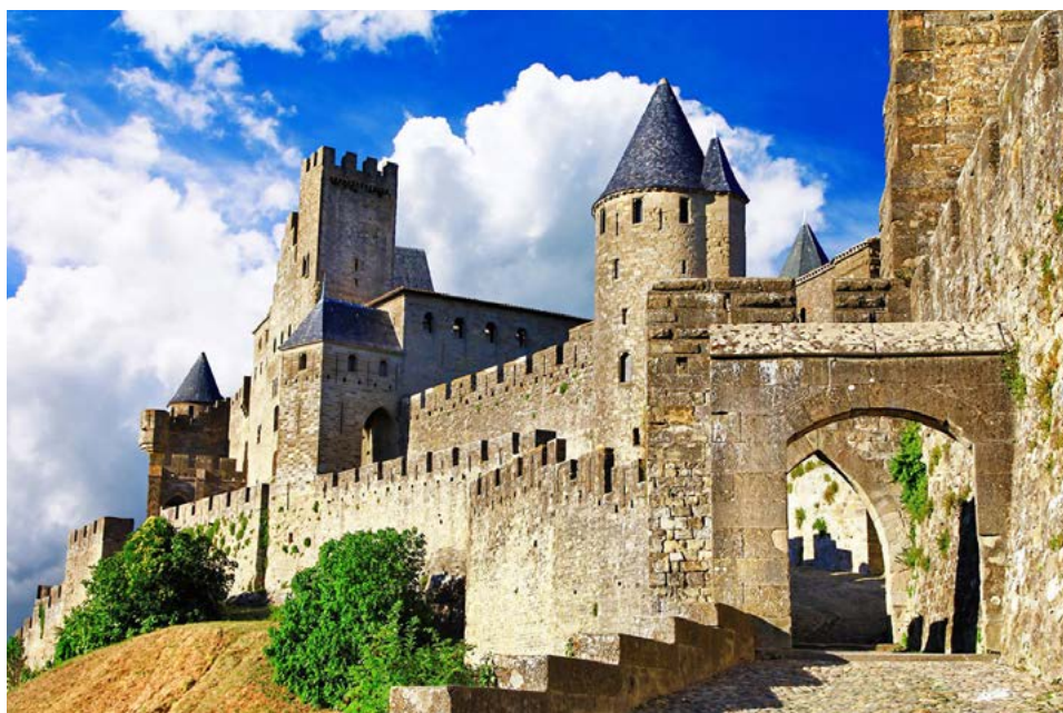
Figura 5. Vista parcial de las murallas de Carcasona, Francia. Se aprecian las torres con las controvertidas cubiertas cónicas impuestas por Le Duc.

Será, por lo tanto, el abanderado de un movimiento de restauración del patrimonio medieval, aparecido en Francia en la década de 1830, cuyas circunstancias le permitirán a Viollet-le-Duc realizar las restauraciones de muchos edificios, muchos edificios, entre estos, castillos, la conocida catedral de Notre-Dame de París (ejecutada durante dos décadas a mitad del siglo XIX) e inclusive a mayor escala como el Mont Saint-Michel o la ciudad de Carcasona en Francia, esta última escenario de numerosas intervenciones proyectadas por Le Duc, las cuales fueron ampliamente criticadas por la utilización de materiales completamente diferentes de los originales, así como alteraciones en el diseño original de varias estructuras como las torres tanto de la muralla como del castillo. Le Duc sustituyó las cubiertas planas, las cuales también actuaban como terrazas, por cubiertas cónicas recubiertas de lajas de pizarra, alterando de esta forma un aspecto arquitectónico propio de la región (figura 5).