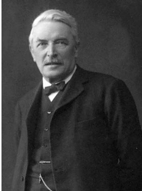
Figura 8. Luca Beltrami (1854 - 1933).