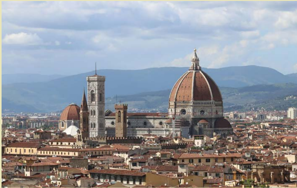
La catedral de Santa María del Fiore en Florencia, Italia.