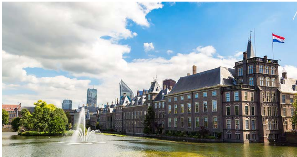
Figura 11. Vista parcial de la zona patrimonial de La Haya. A pesar del evidente desarrollo urbano, los activos patrimoniales están celosamente protegidos.

internacional (figura 11). El producto más importante de dicha convención fue el primer tratado internacional que habla exclusivamente de la protección de los bienes culturales en caso de guerra. El acuerdo se firmó en 1954 y entró en vigor un año después por iniciativa y bajo los auspicios de la Organización de las Naciones Unidas para la Educación, la Ciencia y la Cultura (UNESCO). Hasta septiembre de 2019, el tratado había sido ratificado por 133 estados. Una primera definición de bienes culturales figura en el artículo I de la Convención. Se refiere al patrimonio cultural mueble o inmueble: monumentos, productos de excavaciones arqueológicas, colecciones científicas, manuscritos únicos, obras de arte y objetos antiguos de interés artístico o histórico, entre otros (UNESCO, 2020).