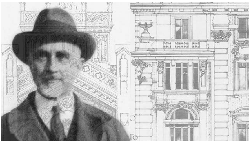
Figura 10. Gustavo Giovannoni (1873 - 1947). https://zero.eu/it/eventi/193217-libri-al-maxxi-gustavo-giovannoni,roma/