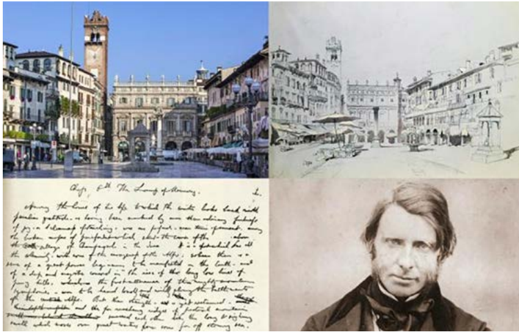
Figura 2. Detalles del estudio hecho por John Ruskin para Piazza delle Erbe en Verona, Italia.

entre sus lectores para convencerlos de la necesidad de un accionar honesto y natural, el renacimiento del prácticamente olvidado trabajo manual y el significado simbólico de cada detalle de la construcción (Pugin, 2013).