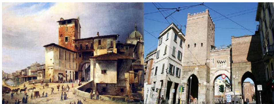
Figura 7. Porta Ticinese. Antes y después de la intervención de Boito. El aspecto actual de la puerta medieval de Milán (vista aquí desde el Corso di Porta Ticinese) se debe a la reconstrucción neogótica de 1865, basada en un proyecto del arquitecto.

En efecto, Boito se caracterizó por las intervenciones sutiles que resaltaban las partes de mayor antigüedad y la adición de nuevos elementos complementarios. Contrario a Le Duc, la propuesta de Camilo Boito aboga por un principio fundamental que fue centrado en la indagación sobre el significado histórico y estético de la edificación. Así bien, resalta la importancia de la documentación fotográfica y la descripción del edificio antes y después de la restauración, al igual que la distinción temporal de las partes restauradas. Boito se caracterizó por las intervenciones sutiles que resaltaban las partes de mayor antigüedad y la adición de nuevos elementos complementarios, los ideales de restauración de Boito se ven claramente reflejados en una de sus intervenciones de mayor distinción: Porta Ticinese (1861) localizada en las antiguas murallas de la ciudad de Milán, al momento de su intervención contaba con los edificios residenciales fruto del crecimiento de la ciudad y pertenecientes a otra época (figura 7).