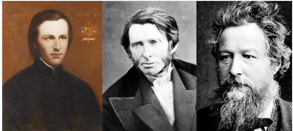
Figura 1. De izquierda a derecha, Augustus Pugin, John Ruskin y William Morris, considerados como los pioneros del preurbanismo culturalista.

El urbanismo actual hace frente al conjunto de transformaciones de las ciudades, en especial aquellas que tuvieron origen con la llegada de la Revolución Industrial, en el siglo XIX. Estudiosos del tema se preocuparon por mejorar las condiciones de vida de la población, por lo que aparecen las primeras respuestas para afrontar un buen número de problemáticas. Es entonces el momento en que se pronuncia un grupo de ingleses, calificados por Choay (1983) como “preurbanistas”, personas que con su pensar y accionar consolidan una serie de propuestas que van a pasar, con el transcurrir del tiempo, de la utopía a la realidad. Es el tiempo de figuras indelebles en la historia del preurbanismo como Augustus Pugin (1812-1852), John Ruskin (1819-1900) y William Morris (1834-1896), abanderados de un movimiento inconformista relativo a la situación precaria en que se encontraban los grandes centros urbanos (figura 1). Así las cosas, propician una fuerte protesta en favor de la ciudad ancestral, la sociedad y, naturalmente, los valores históricos y patrimoniales que se veían socavados por la presión desintegradora de la industrialización.