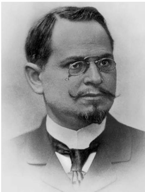
Figura 9. Alois Riegl (1858 -1905).

Historiador del arte austriaco, graduado en la Universidad de Viena y miembro de la Escuela de Historia del Arte de Viena (figura 9). Riegl debe su fama sobre todo gracias a las teorías que ven en la “voluntad artística” ( Kunstwollen ), o sea, el factor central la producción de un artista que va relacionado con el “estilo”. Además, fue ejemplar al esclarecer la forma en que el espectador de una obra de arte se involucra en un proceso mental y creativo llamado “la parte del observador” (Iversen, 2003).