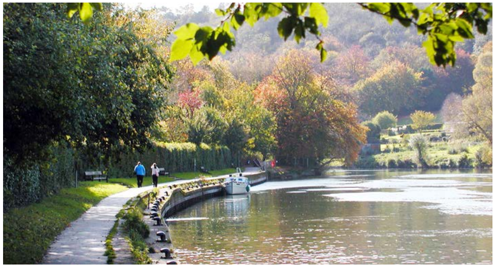
Figura 3. Una vista del río Támesis, ampliamente evocado por William Morris, a su paso por Henley-on-Thames en el apacible condado de Oxfordshire.

Por tanto, se puede inferir que, en la novela de Morris, el viaje por el Támesis es a la vez un viaje simbólico en una búsqueda de la felicidad que obliga a recorrer un territorio donde el paisaje y la sociedad han sido transformados por el impacto negativo de las industrias que surgen en una ciudad sin algún control o planificación. La sociedad agraria a la cual el autor se refiere y pondera, funciona simplemente porque las personas encuentran placer en la naturaleza y goce en el trabajo que desempeñan en un entorno agreste y bucólico (figura 3).