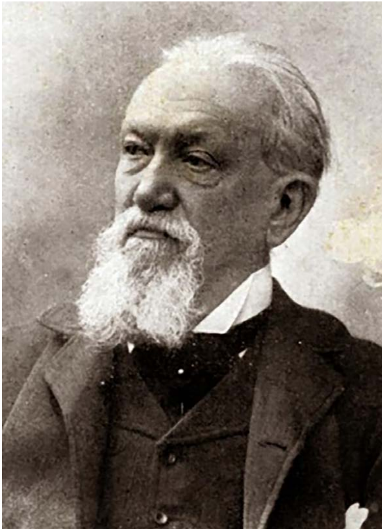
Figura 6. Camilo Boito (1836-1914).

El accionar de este arquitecto, crítico de arte y académico italiano se basa en un principio fundamental estrechamente ligado a la indagación sobre el significado histórico y estético de la edificación (figura 6).