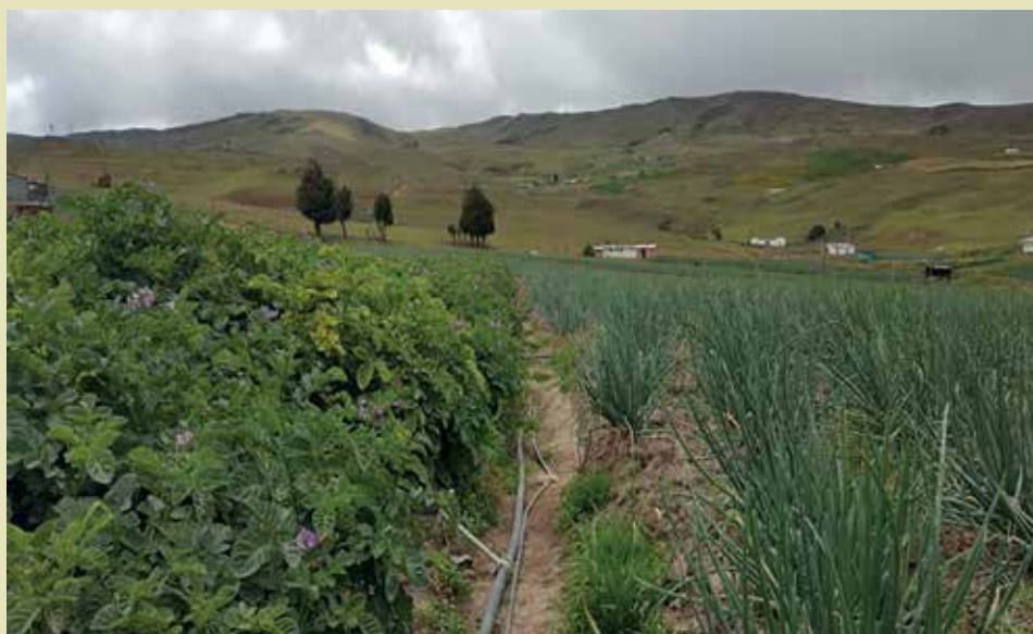
Cultivos de papa y cebolla en un área periurbana del Centro Poblado del corregimiento de Berlín

DOI: http://dx.doi.org/10.15332/rev.m.v11i2.1724