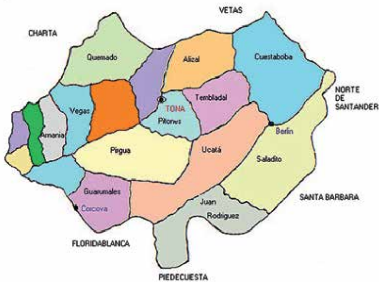
Figura 2. Subdivisión del municipio de Tona en 16 Veredas