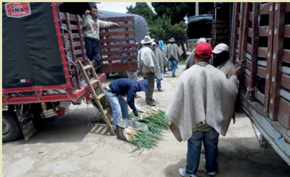
Actividades de acopio y distribución de cebolla en inmediaciones del parque del Centro Poblado del Corregimiento de Berlín