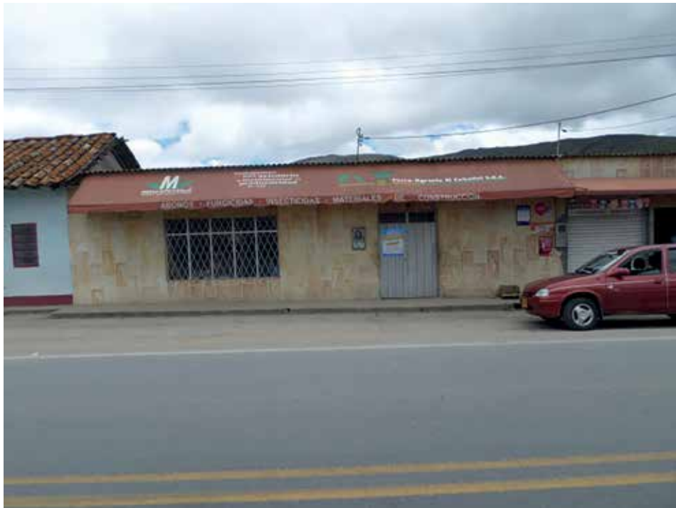
Figura 3. Dos aspectos de la vía nacional que conecta Cúcuta y Bucaramanga