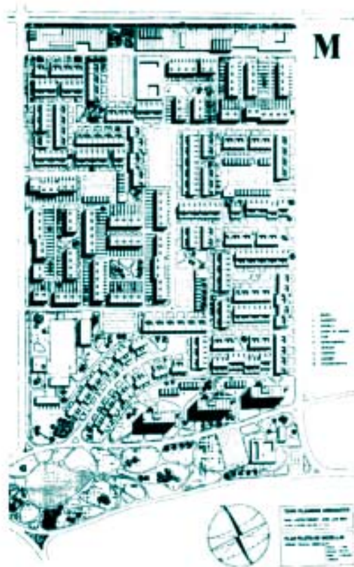
[42] Josep Lluís Sert, Paul Lester Wiener. Plan Director de Medellín, 1947. Modelo de un sector de vivienda

Josep Lluís Sert, Paul Lester Wiener Plan Director de Medellín, 1947. Modelo de un sector de vivienda Tomado de: Hofer Andreas, Karl Brunner y el urbanismo europeo en América Latina, Áncora editores, Bogotá, 2003