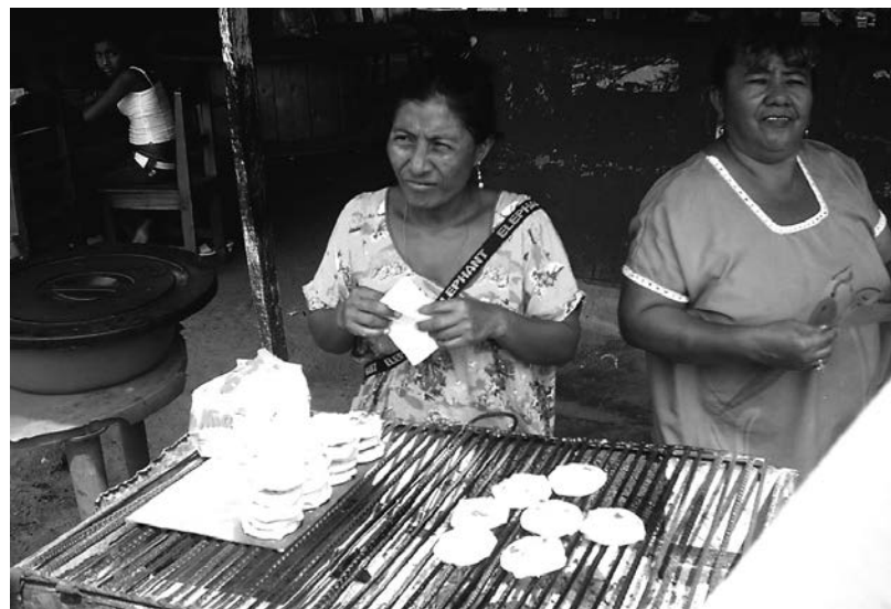
Figura 7. Indígena Wayuu