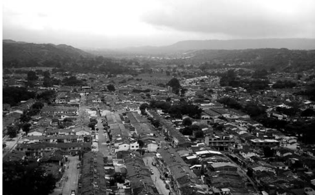
Figura 8. Valle del Río Frío, visto desde Girón