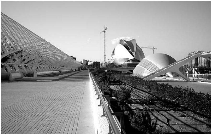
Figura 6. La ciudad de Las Ciencias de Calatrava

Cuestiones de orden fisiológico opuestas al orden político, social y económico, parecen dificultar la realización de la ciudad posible, sin embargo ya Hegel en 1807 veía más fácil esta realización, “Buscad primero comida y vestimenta, que el reino de Dios se os dará por sí mismo”. (Fig. 7)