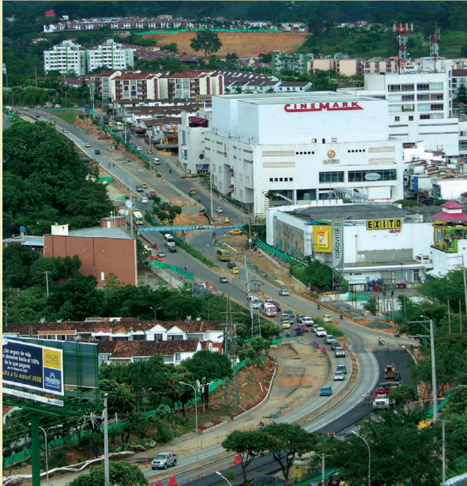
Panorámica Autopista Bucaramanga a Floridablanca, Sector Cañaveral