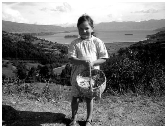
Figura 9. Niña boyacense vendedora de melcochas, Laguna de Tota