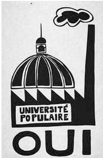
Figura 1. Logo de la Escuela de Bellas Artes de París

La palabra “urbanismo”, en la historia del pensamiento, es reciente, según G. Bardet aparece por primera vez en 1910 en el Bulletin de la Société Géographique de Neufchatel, en un texto de P. Clerget 1 , la société française des architectes-urbanistes fue fundada en 1914, el Institut d'urbanisme de la universidad de París fue creado en 1924 y el urbanismo se incluyó por primera vez en el programa de la Escuela de Bellas artes de París en 1953 (Fig. 1). El diccionario Larousse define el urbanismo como “ciencia y teoría del establecimiento humano” 2 .