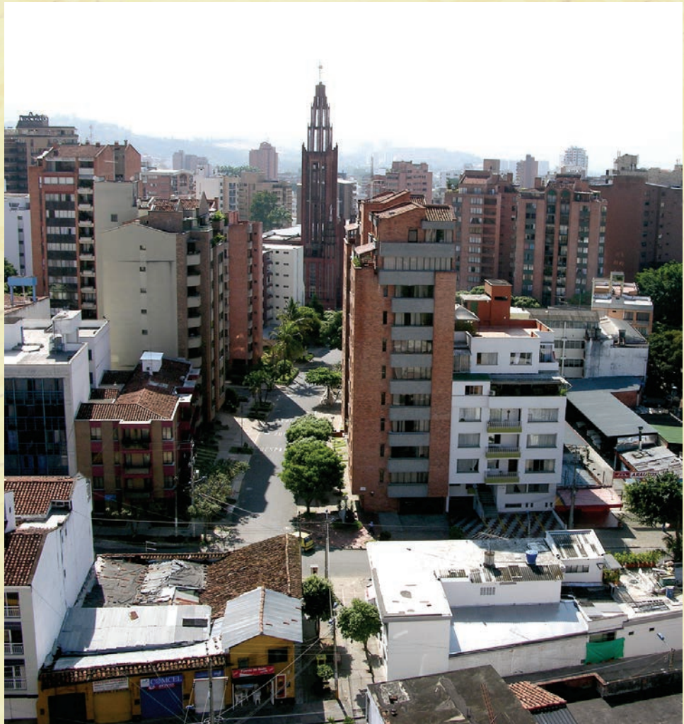
Panorámica Barrio sotomayor - Bucaramanga