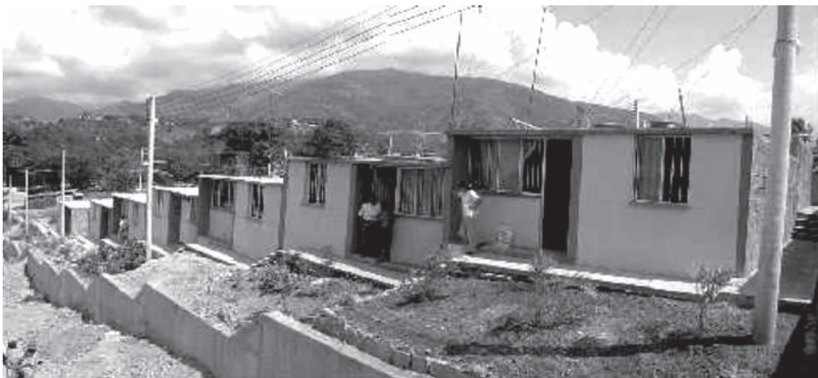
Figura 4. Vista de la fachada de seis (6) de las doce viviendas que se construyeron con los recursos girados. Nótese el buen aspecto y uniformidad en las viviendas y la presencia de postes y redes del servicio de energía eléctrica