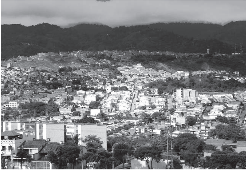
Figura 3. Panorámica parcial de barrios populares Zona del Norte de Floridablanca

La dinámica de la ciudad es política, económica y social, pero ante todo espiritual. Depende del grado de desarrollo de los hombres como hombres. Si han alcanzado, en este desarrollo, el nivel de conciencia, autoconciencia, o razón.