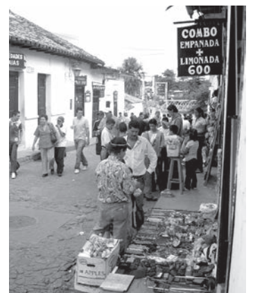
Figura 5. Vendedores ambulantes - Girón