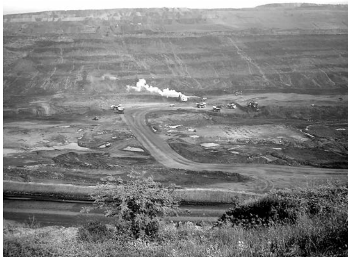
Figura 10. Explotación minera Cerrejón Zona Norte

Hoy, el mercado de libre competencia propio del liberalismo, se transforma en el mercado monopólico de las empresas multinacionales propio del neoliberalismo. La producción se orienta al mercado internacional y el mercado interno se degrada. La situación económica es de desempleo, pobreza, informalidad y desaprovechamiento de los recursos naturales que no tienen demanda en el exterior. (Fig. 10)