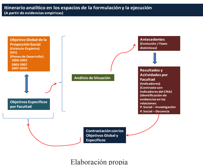
Figura 2. Esquema de Análisis

La metodología permitió indagar acerca de los procesos de formulación de los proyectos y analizar la coherencia de los objetivos del Programa Desarrollo Comunitario y de la proyección social desde la perspectiva de las Facultades con los lineamientos del Estatuto Orgánico y del Proyecto Educativo Institucional –PEI- de la USTA. Como resultado se propuso un conjunto de indicadores para la planeación y el seguimiento de la proyección social y recomendaciones pertinentes para el fortalecimiento del Programa. La Figura 2 ilustra sobre el proceso analítico aplicado.