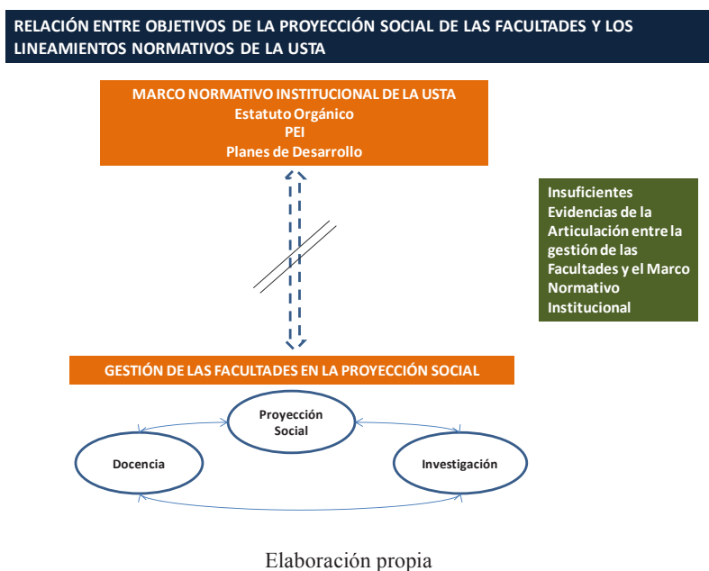
Figura 5. Esquema de Análisis

Una de las conclusiones sobre el particular es la necesidad que tienen las Facultades de precisar, desde la naturaleza de sus disciplinas, los objetivos de proyección social y extensión, preferiblemente frente a problemas y necesidades del país, identificados y priorizados. La definición de objetivos facilita el diseño de estrategias y metas, relacionadas con la investigación y la docencia. La Figura 5 ilustra, con la flecha de líneas punteadas, la necesidad de superar el desencuentro que en algunas facultades existe entre los lineamientos normativos de la USTA y los objetivos específicos de la proyección social desde la perspectiva de sus programas.