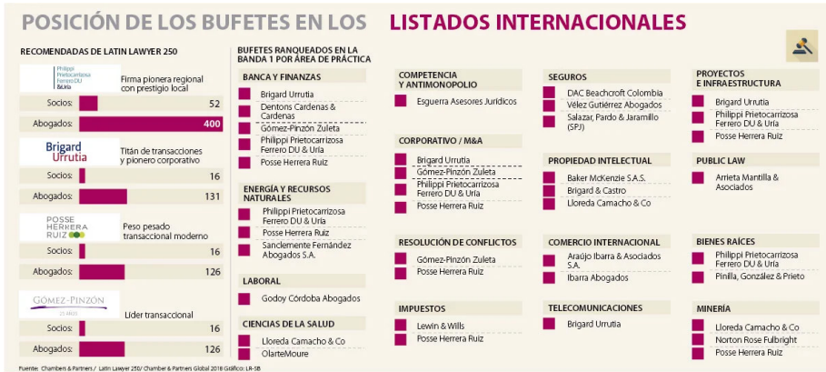
Gráfica 2. Posición de los bufetes de abogados en listados internacionales

implicaciones jurídicas de la legislación nacional e internacional materializada por fuentes propias del derecho o fincadas en reductos complementarios como los tratados de libre comercio. En su defecto, el sector debe reconocer en la estructura jurídica que lo identifica como uno de los más problemáticos por lo que implica el acceso a la propiedad, la tenencia y los derechos reales creados al margen de este, además, de la diáspora social creada bajo dichos trámites en sí.