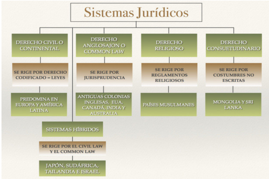
Gráfica 1. Sistemas jurídicos