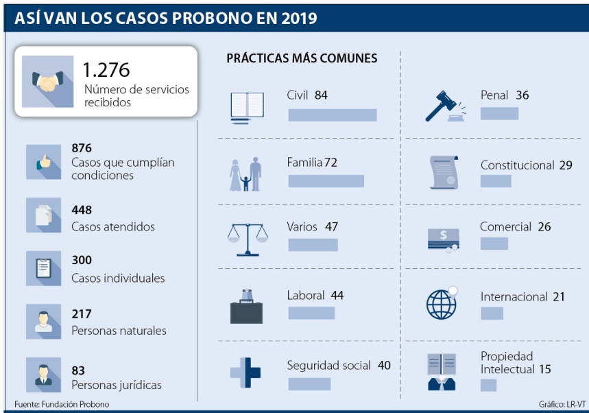
Gráfica 9. Casos Probono 2019