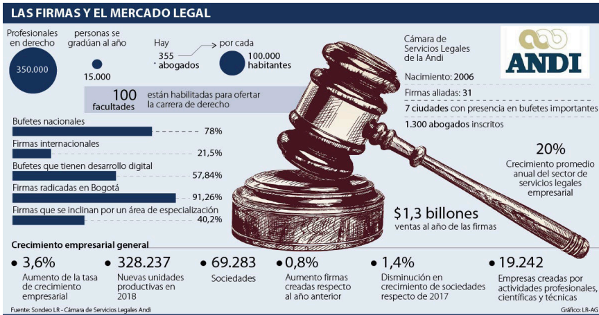
Gráfica 7. Las firmas y el mercado legal