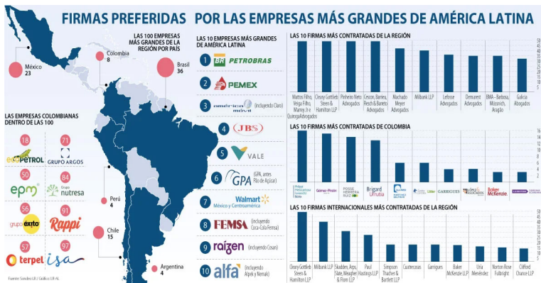
Gráfica 4. Relación de firmas preferidas por las empresas más grandes de América Latina

La industria de procesamiento y transformación a la par que está afincada en los albores de la infraestructura civil, física e ingenieril corresponde al sector secundario o industrial. En este frente, la legislación internacional ha avanzado un poco más en cuanto a lo que corresponde al componente de provisión sobre las conductas jurídicas que en ellas debe destacarse. No obstante, en el frente de discusión diseminado en la capacidad de orden gerencial jurídico que puede crearse en dicho espacio, la realidad, es que tienen los mismos problemas en cuanto a la provisión de criterios de fondo sobre los cuales entender su papel como estructuras que igualmente debe convertir la legislación en referencia organizacional.