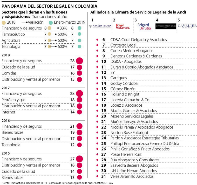
Gráfica 6. Panorama del sector legal en Colombia