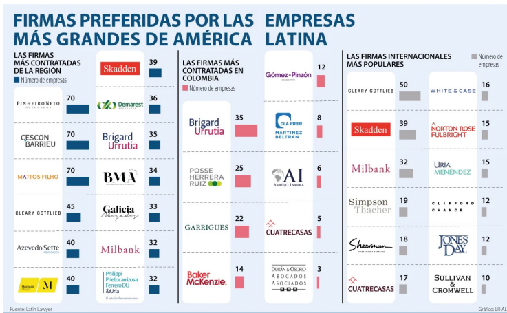
Gráfica 5. Relación de firmas más contratadas

El proceso de certificación o normalización internacional, más propio de la regulación económica, es quien ha tomado bandera a la hora de asumir la provisión de instrumentos jurídicos establecidos en los componentes ambientales y técnicos para poder desarrollar sus actividades. En este momento, es este frente quien domina el campo de interés de las empresas, que atentas por esta circunstancia, han terminado por dirigir su frente de atención a este elemento, dejando a un lado, la jerarquía que en este y otros temas seguirá teniendo la legislación internacional. Así, las empresas, particularmente las más visibles o de mayor impacto, deben estudiar permanentemente los pormenores del panorama jurídico.