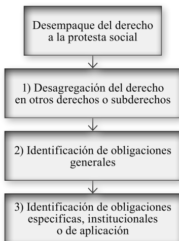
Ilustración 2. Metodología de investigación para aplicar el desempaque del derecho a la protesta social

Un primer momento de la investigación correspondió a la búsqueda y selección de fuentes de información en el SIDH sobre el derecho a la protesta social. En este apartado fue clave identificar tratados y convenios regionales, jurisprudencia y relatoría de la Corte y Comisión Interamericanas que abordasen directa o indirectamente la temática en cuestión. Así mismo, se tuvo en cuenta que estas fuentes de información fuesen relevantes y pertinentes para el desarrollo del problema jurídico planteado. Posterior a la selección de instrumentos del SIDH sobre la temática por estudiar, se dio paso a la lectura y análisis de las fuentes de información seleccionadas (segundo momento de investigación). Seguido a lo anterior, correspondió la realización en sentido estricto del desempaque del derecho a la protesta social, cuyo subproceso se realizó de la siguiente manera: