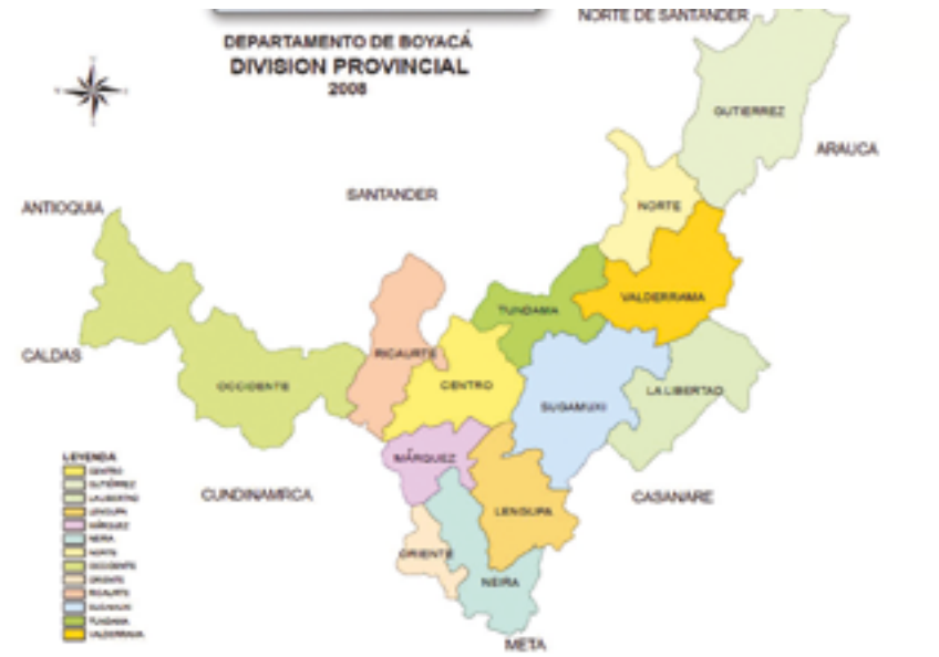
Mapa 1. División provincial de Boyacá