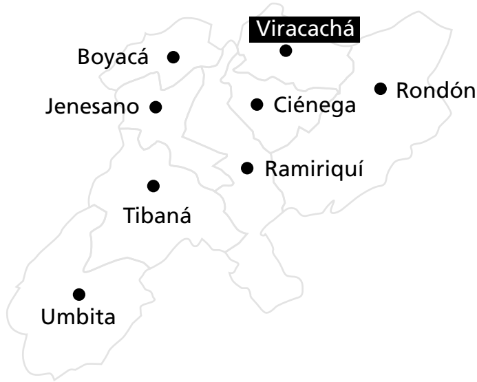
Mapa 2. Municipios de la provincia de Márquez