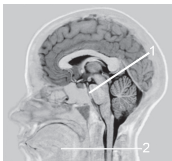
FIG. 1. CORTE SAGITAL DE UNA SECUENCIA DE RM PULSO DE INVERSIÓN PARA LA LOCALIZACIÓN DE LA ADQUISICIÓN DE LAS IMÁGENES PERPENDICULAR AL 1) ACUEDUCTO DE SILVIO Y SENOS VENOSOS Y 2) NIVEL PERIMEDULAR C2C3

El posproceso de las imágenes se inicia marcando un punto semilla dentro de la región analizada es ésta la única interacción del usuario en el proceso. Para la segmentación de las regiones de interés ( regions of interest, ROI ), se utiliza la información temporal del flujo a lo largo del ciclo cardiaco, de esta manera el método es independiente de la relación intensidad-sígnal, inconveniente que se presenta en los métodos que usan la información espacial para realizar la segmentación.