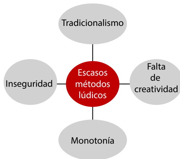
Figura 3. Escasos métodos lúdicos

La categoría emergente titulada “falta de motivación” establece vínculos entre el desinterés de los ET, la falta de estímulo por parte de los DC, el tradicionalismo y la carencia de creatividad en el desarrollo de la escritura. Es válido señalar que, aunque el objeto de estudio se centró en la oralidad, siempre estuvo relacionado con la escritura, como se analizó desde la teoría base y las respuestas