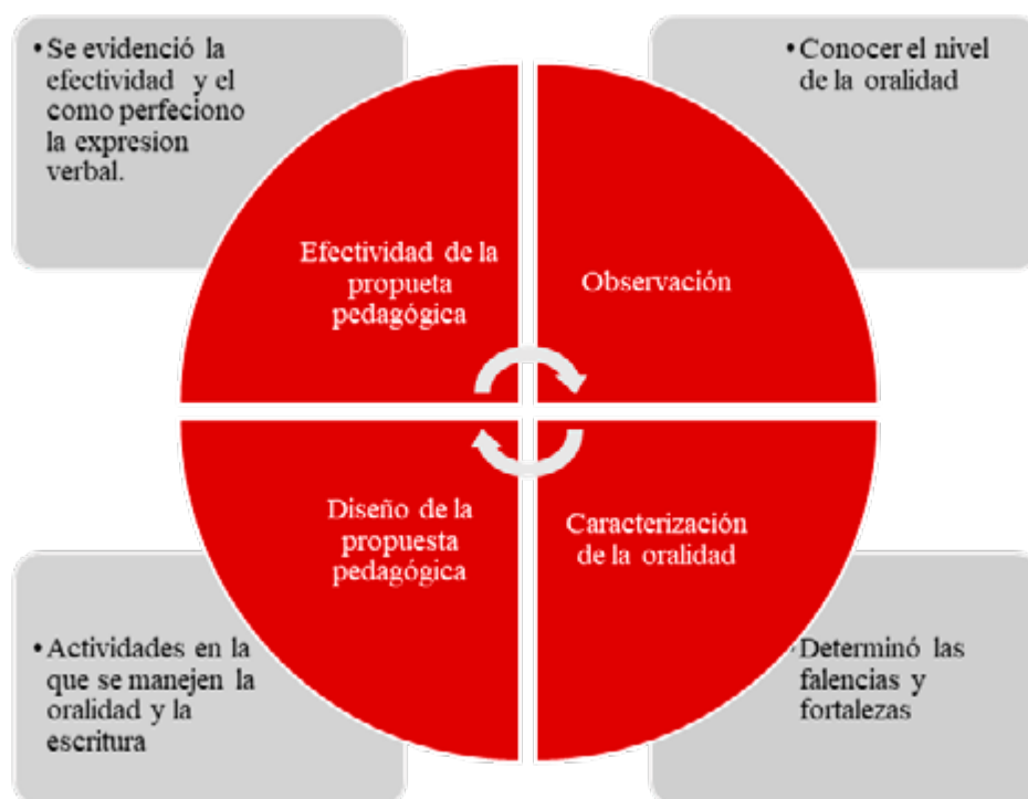
Figura 2. Fases de la investigación

Tal como se evidencia en la figura los informantes clave corresponden a las personas o al grupo que genera una muestra en la aplicación de las técnicas y quien permite el análisis de los resultados, tal como lo mencionan Goetz y Lecompte (1988), quienes precisan la importancia de que esta muestra sea eficiente frente a los datos suministrados, se refiere a que este enfoque optimizará y afianzará el trabajo por realizar en la implementación de ideas para su corrección. Frente a esta investigación, los informantes clave (IC) permitieron tomar muestra de su trabajo en el quehacer pedagógico como lo es la docencia, se establecieron preguntas que generaron categorías por las cuales se planteó el desarrollo de la misma estrategia pedagógica con el apoyo teórico y conceptual de Ong. Los docentes codificados como Dc1, Dc2, entre otros, fueron escogidos en diferentes colegios de la ciudad para evitar la recolección de temas aislados, por tanto, los estudiantes codificados como Et1, Et2 y demás, son estudiantes del grado décimo del colegio New Cambridge School.