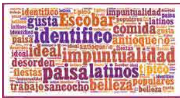
Figura 2. Nube semántica