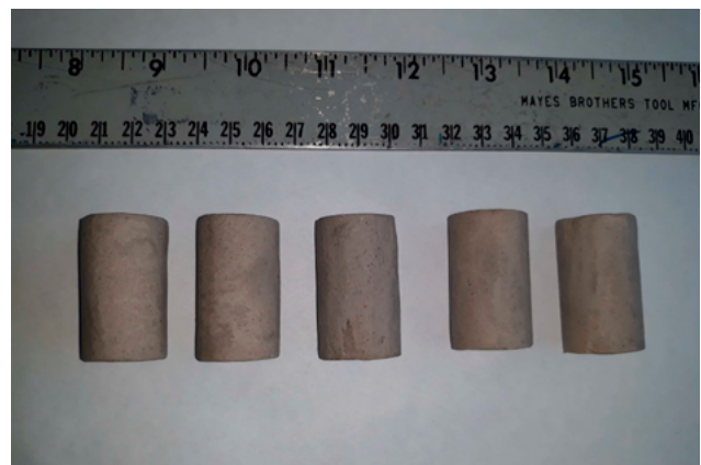
Figura 3. Muestras de yeso para compresión axial.

Los resultados obtenidos en las pruebas mecánicas realizadas al material reciclado tienen un comportamiento catalogado como normal, de acuerdo con la Norma Técnica Colombiana NTC 562 de materiales dentales - yesos, con valores promedio del módulo elástico de 303,62 Mpa y resistencia última a la compresión de 4,35 Mpa (Tabla 1).