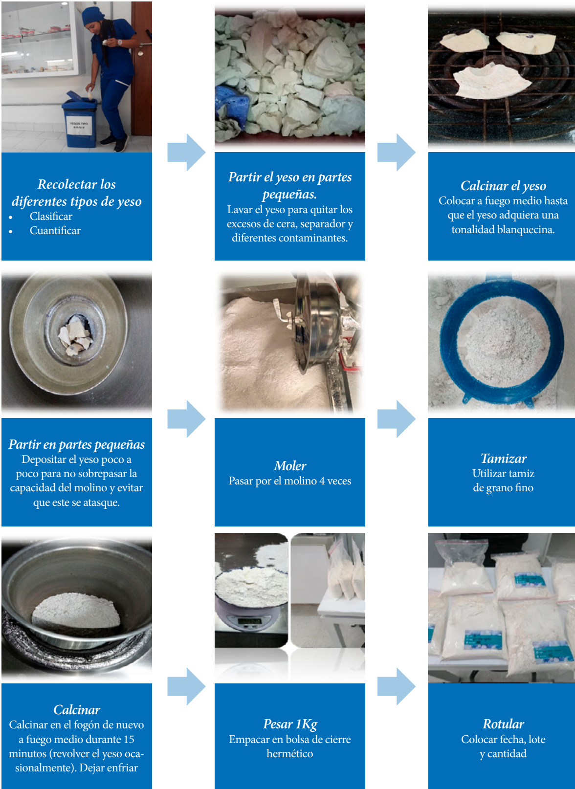
Figura 1. Protocolo de adecuación del yeso. A. Etapa de recolección a calcinación; B. Molido y tamizaje del yeso; C. Calcinación, pesado y rotulación del yeso.