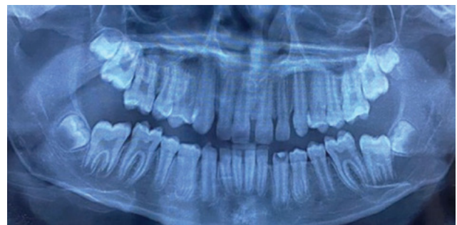
Figura 1. Radiografía panorámica previo inicio del tratamiento