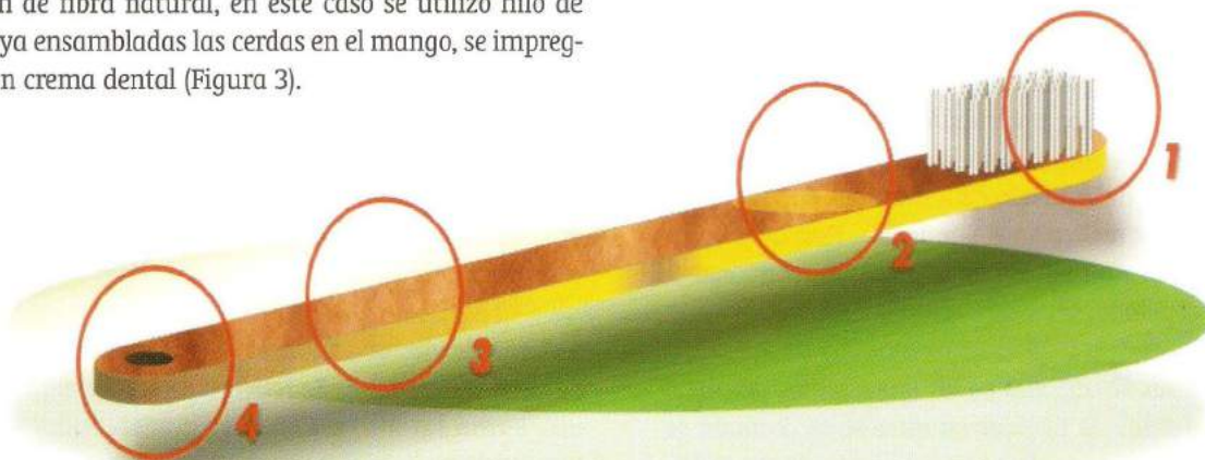
Figura 3. Características del diseño del cepillo dental

Evaluación preliminar y exploración del mercado potencial: La investigación de mercados, para explorar el grado de aceptabilidad del nuevo producto, se llevó a cabo en la ciudad de Bucaramanga, tomando como mues-