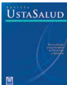
Ustasalud ISSN: 1692-5106 Impreso ISSN: 2590-7875 Online

Para la consecución de algún ejemplar, contactar al Departamento de Publicaciones Teléfono: 6800801 extensiones: 1312 - 1309