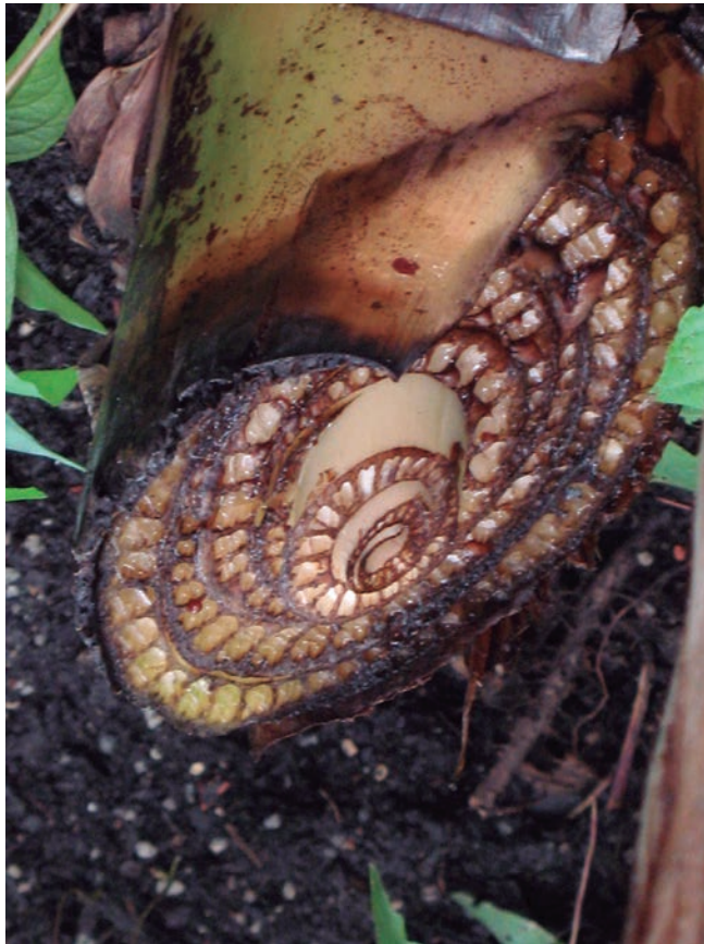
Figura 2. Crecimiento en espiral de una planta de plátano en "Eden Project".

Un ejemplo del tema tratado podrían ser los moluscos, presentándose en ellos un patrón formal de crecimiento. La concha de los moluscos está hecha de un material calcificado que, durante su crecimiento, se adiciona continuamente sobre los bordes bajo una configuración en espiral.