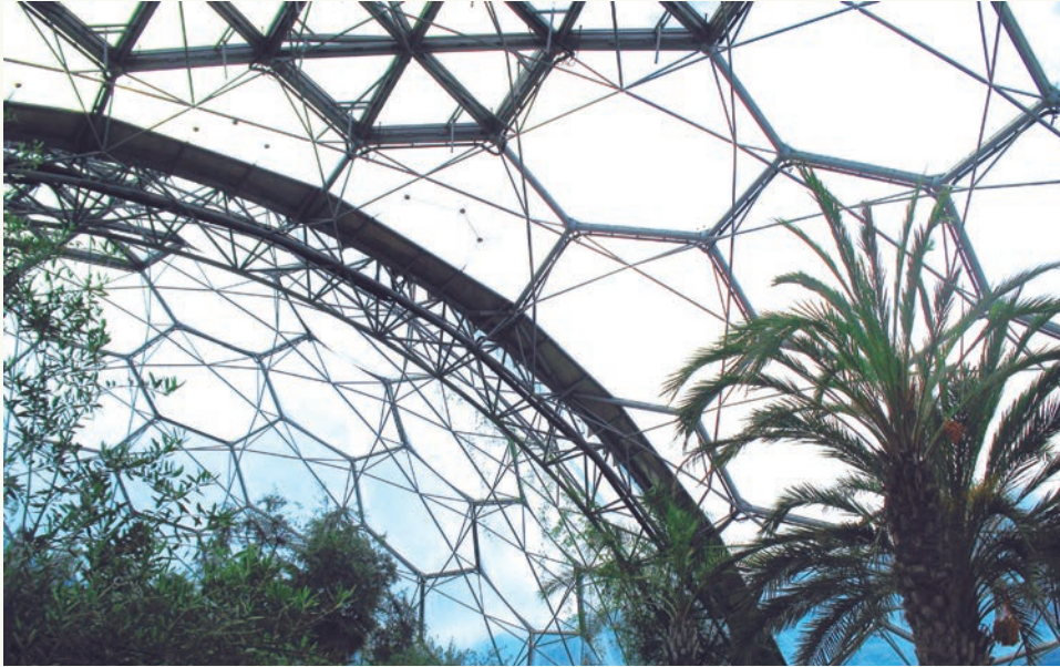
Detalle de cubierta en "Proyecto Edén", Inglaterra. Fotografía de Leonardo Moreno de Luca, 2011.