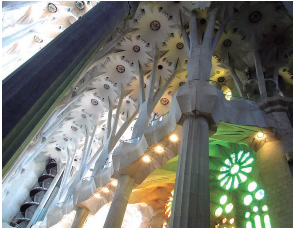
Figura 1. Catedral Sagrada Familia, Barcelona, España. Foto Arquitecto Pedro Gómez Bejarano.

Como se puede ver en los ejemplos anteriores, la biomímesis es aplicable en muchos campos distintos, siendo del interés de los autores el referente al diseño arquitectónico y estructural. Por consiguiente, a continuación se presenta una estructura encabezada por tres componentes principales, forma, procesos y estructura. Dentro de cada uno de ellos se despliegan algunos principios biomiméticos que corresponden al tema de interés.