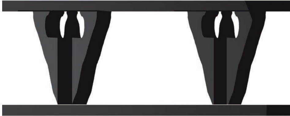
Figura 8A. Optimización por medio del método SKO de una estructura en 2D para resistir una carga vertical uniformemente distribuida. Elaboración de los autores.

Adicionalmente, se han llevado a cabo aplicaciones de computación evolutiva que pretenden integrar el diseño estructural con el arquitectónico, algunas de ellas pueden encontrarse en 52 53 54 55 .