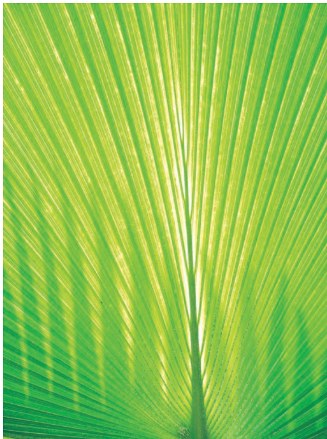
Figura 4. Mecanismo de rigidización de una hoja de gran superficie en "Eden Project". Fotografía de Leonardo Moreno de Luca, 2011.

El resultado de este diseño fue bastante satisfactorio al obtener una viga con un peso despreciable y una rigidez bastante alta, es decir, su relación peso/rigidez es muchas veces más eficiente que la mayoría de los elementos estructurales utilizados en los sistemas constructivos tradicionales.