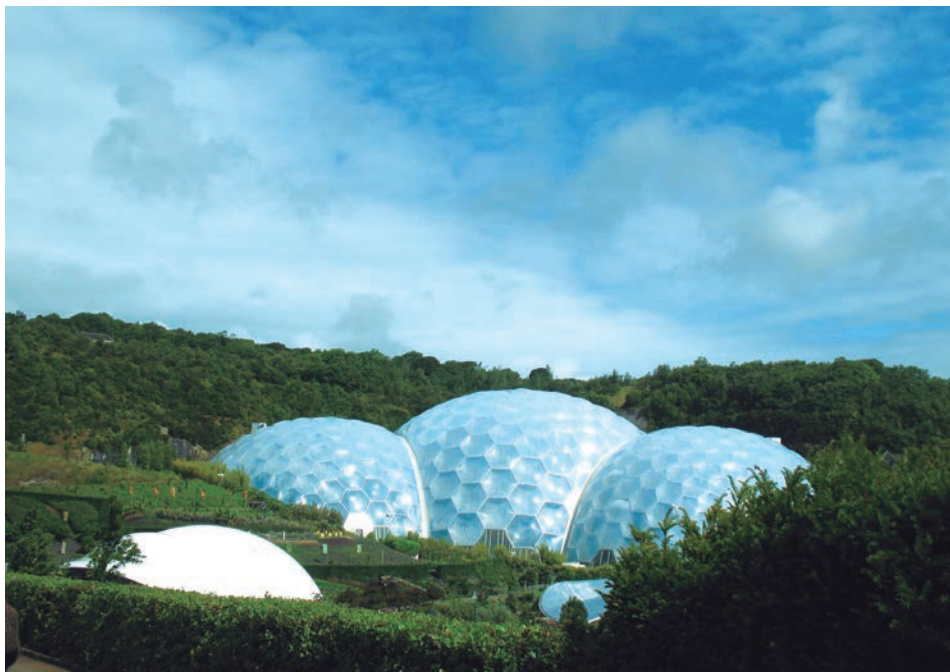
Figura 6. “Eden Project”. Fotografía de Leonardo Moreno de Luca, 2011.

De esta manera, la adaptación se plantea como una característica que permite resolver situaciones dinámicas a las que está expuesta una estructura, como por ejemplo, los sismos y los fenómenos naturales. Se cree que es posible diseñar y construir estructuras que se