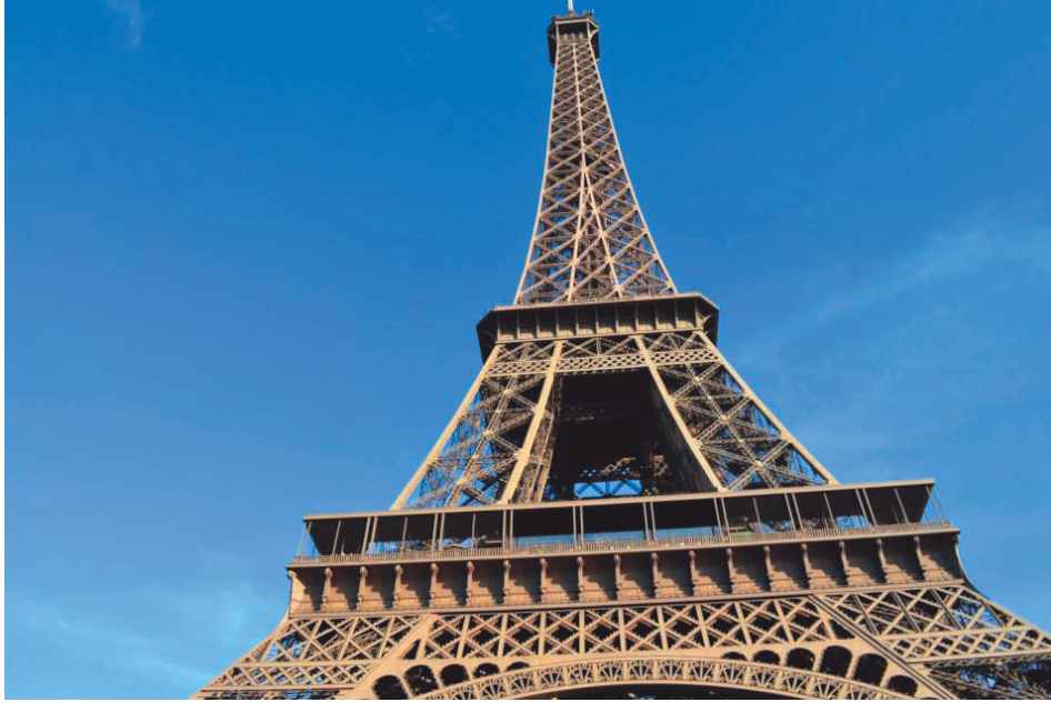
Figura 9. Torre Eiffel.

Para concluir, uno de los pocos ejemplos, y uno de los más representativos del uso de niveles jerárquicos en estructuras civiles, es la Torre Eiffel que presenta en promedio 3 niveles de jerarquía.