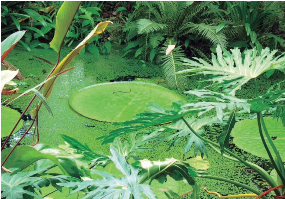
Figura 3. Lillypad en "Eden Project". Fotografía de Leonardo Moreno de Luca, 2011

Este tipo de revestimiento reduce los periodos de mantenimiento que se dan tradicionalmente en los revestimientos comunes, prolonga así la durabilidad del material empleado y reduce los fuertes impactos ambientales que producen los detergentes o químicos usados en este fin.