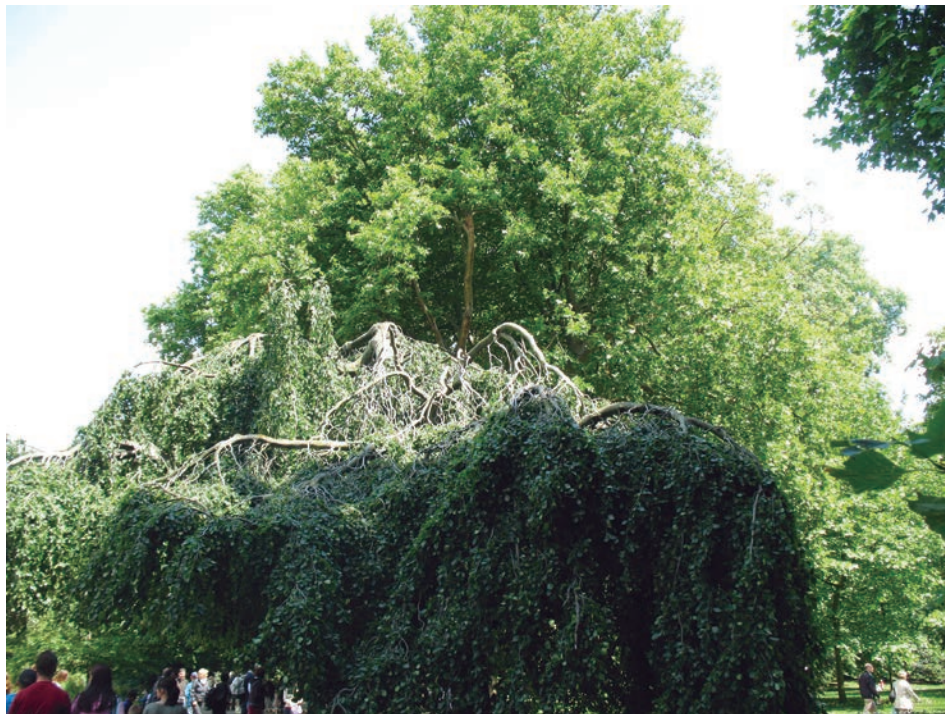
Figura 5. Adaptabilidad de un árbol a sus condiciones de carga sin llegar a la falla.

La flexibilidad en una estructura tiene grandes beneficios si se desea que presente cierta adaptabilidad bajo determinadas condiciones de carga o, alguna situación en particular. En este sentido, se toma lo planteado por Vogel 30 , en lo referente a la flexibilidad de las hojas de un Tulipero. Las hojas, debido a su flexibilidad, cambian su forma en función de la velocidad del viento. De esta manera, adquieren una determinada geometría para un viento suave (5m/s) y, otra totalmente distinta para un viento más fuerte (20m/s).