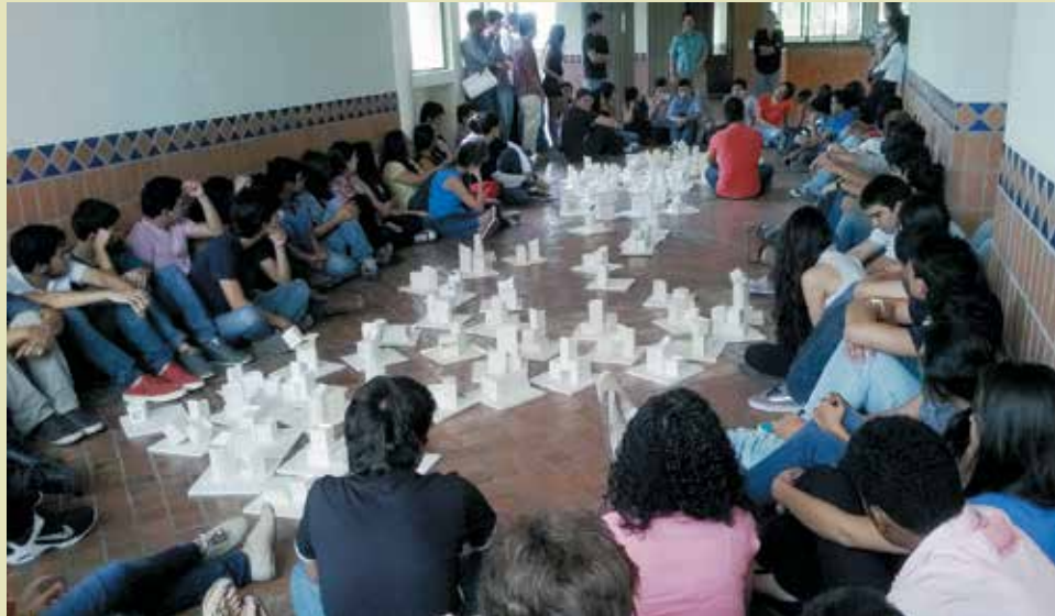
Taller de inducción en la Facultad de Arquitectura.

* Artículo resultado de investigación científica aprobado en Convocatoria Interna de la Universidad Santo Tomás de Bucaramanga, 2012-2013.