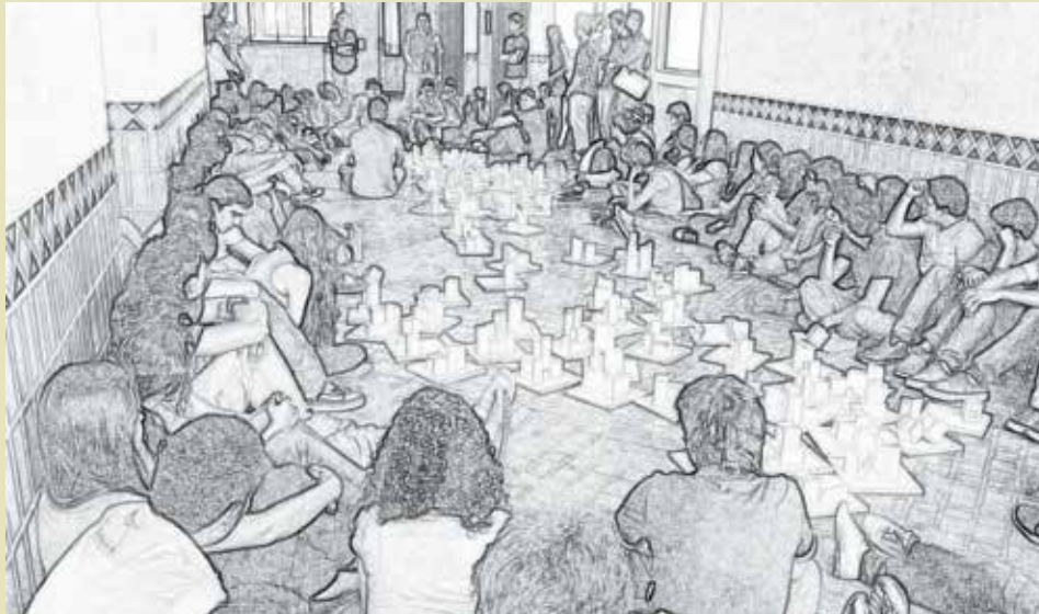
Taller de inducción en la Facultad de Arquitectura.