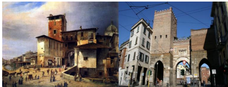
Figura 7. Porta Ticinese. Antes y después de la intervención de Boito. El aspecto actual de la puerta medieval de Milán (vista aquí desde el Corso di Porta Ticinese) se debe a la reconstrucción neogótica de 1865, basada en un proyecto del arquitecto.

Contrario a Le Duc, la propuesta de Camilo Boito aboga por un principio fundamental fue centrado en la indagación sobre el significado histórico y estético de la edificación. Así bien, resalta la importancia de la documentación fotográfica y la descripción del edificio antes y después de la restauración, al igual que la distinción temporal de las partes restauradas. Boito, se caracterizó por las intervenciones sutiles que resaltaban las partes de mayor antigüedad y la adición de nuevos elementos complementarios, los ideales de restauración de Boito se ven claramente reflejados en una de sus intervenciones de mayor distinción: Porta Ticinese (1861), localizada en las antiguas murallas de la ciudad de Milán, al momento de su intervención contaba con los edificios residenciales fruto del crecimiento de la ciudad y pertenecientes a otra época (ver figura 7).