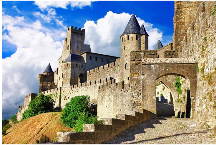
Figura 5. Vista parcial de las murallas de Carcasona (Francia). Se aprecian las torres con las controvertidas cubiertas cónicas impuestas por Le Duc.

lajas de pizarra, alterando de esta forma un aspecto arquitectónico propio de la región (ver figura 5).