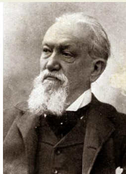
Figura 6. Camilo Boito (1836-1914)