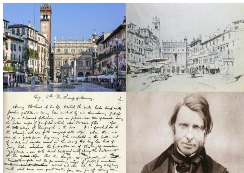
Figura 2. Detalles del estudio hecho por John Ruskin para Piazza delle Erbe en Verona (Italia).

Publicado por primera vez en 1836, el manuscrito le dio rápidamente un nombre como profesional, crítico y escritor por ser el primer manifiesto arquitectónico revolucionario del siglo XIX que vendría a ser considerado como la primera gran obra canónica de la arquitectura occidental moderna. Sus principios tocaron acordes profundamente comprensivos entre sus lectores para convencerlos de la necesidad de una accionar honesto y natural, el renacimiento del prácticamente olvidado trabajo manual y el significado simbólico de cada detalle de la construcción (Ibídem).