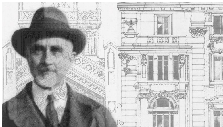
Figura 10. Gustavo Giovannoni (1873 - 1947)

Arquitecto italiano, oriundo de Roma cuya premisa más importante de este italiano fue la reinterpretación de las edificaciones patrimoniales para la restauración de su esencia (Ver figura 10).