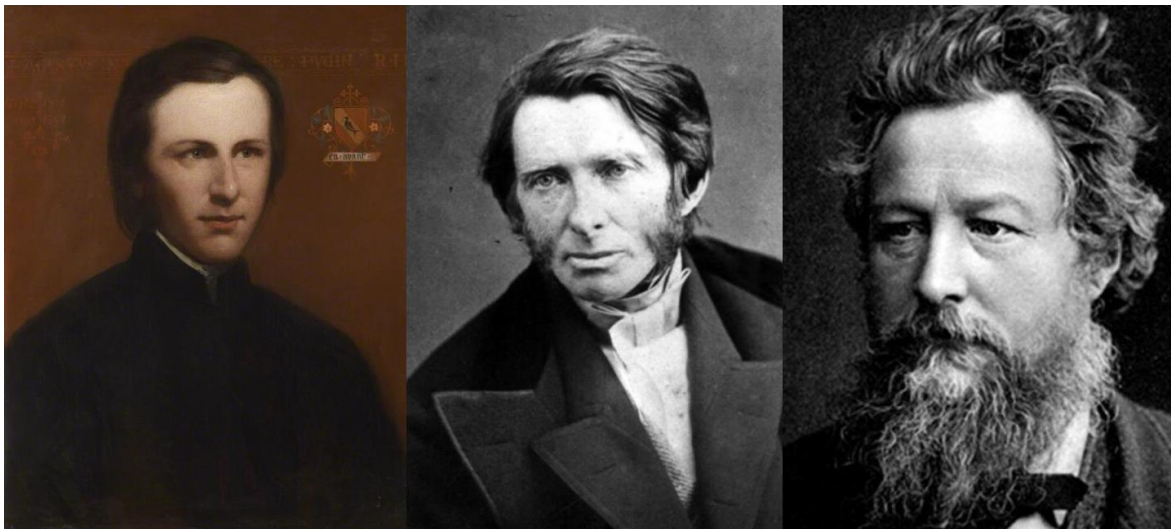
Figura 1. De izquierda a derecha, Augustus Pugin, John Ruskin y William Morris, considerados como los pioneros del preurbanismo culturalista.

propuesta que van a pasar, con el paso del tiempo, de la utopía a la realidad. Es el tiempo de figuras indelebles en la historia del preurbanismo como Augustus Pugin (1812-1852), John Ruskin (1819-1900) y William Morris (1834-1896), abanderados de un movimiento inconformista relativo a la situación precaria en que se encontraban los grandes centros urbanos (Ver figura 1). Así las cosas, propician una fuerte protesta en favor de la ciudad ancestral, la sociedad y, naturalmente, los valores históricos y patrimoniales que se veían socavados por la presión desintegradora de la industrialización.