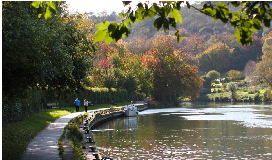
Figura 3. Una vista del río Támesis, ampliamente evocado por William Morris, a su paso por Henley-on-Thames en el apacible condado de Oxfordshire.

democrático de los medios de producción. En su recorrido descubre una sociedad que ha cambiado más allá de aquella típica de la ciudad industrial: un paraíso pastoral en el que todas las personas viven en feliz igualdad y satisfacción (Morris, 1993).