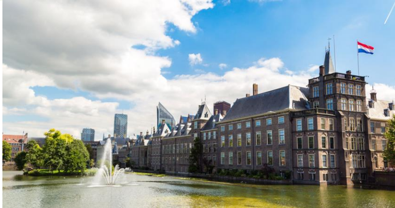
Figura 11. Vista parcial de la zona patrimonial de La Haya. A pesar del evidente desarrollo urbano, los activos patrimoniales están celosamente protegidas.

Después de la Segunda Guerra Mundial, no aparece ninguna carta específica sobre la restauración, pero si tienen lugar encuentros que abordan la temática como lo fue la “Convención para la Protección de los bienes culturales en caso de conflicto armado”, en La Haya, importante centro urbano de los Países Bajos gracias a la presencia de entes administrativos que emiten normativas y dictámenes de orden legal, sobre todo en ámbito internacional (ver figura 11). El producto más importante de la dicha convención el primer tratado internacional que trata exclusivamente de la protección de los bienes culturales en caso de guerra. El acuerdo se firmó en 1954 y entró en vigor un año después por iniciativa y bajo los auspicios de la Organización de las Naciones Unidas para la Educación, la Ciencia y la Cultura (UNESCO). Hasta septiembre de 2019, el tratado había sido ratificado por 133