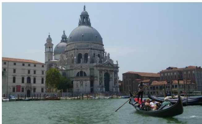
Figura 12. Venecia, ciudad con características únicas entre todas las ciudades del mundo, ha sabido salvaguardar y resaltar su patrimonio cultural hasta el punto de

y Técnicos de Monumentos, que se reunió en la inigualable ciudad de Venecia del 25 al 31 de mayo de 1964 (Ver figura 12). En “la serenísima” se definió una nueva carta de restauración llamada "Carta de Venecia", la cual se estructuró con los valiosos aportes de eruditos italianos como Roberto Pane, Pietro Gazzola y Cesare Brandi (Rivera, 2020). La carta consta de 16 artículos y resume admirablemente los principios que pueden considerarse inmutables de la metodología de la restauración arquitectónica. Este mapa enfatiza sobre todo la importancia del aspecto histórico de un edificio, e introduce por primera vez el concepto de conservación también del entorno urbano que rodea a los edificios monumentales. En otras palabras, se establecen los principios de una correcta restauración, desde un punto de vista filosófico y técnico para profundizar en el tema del concepto de conservación, extendiéndolo a un ámbito urbano como envolvente del monumento histórico (ICOMOS, 1965).