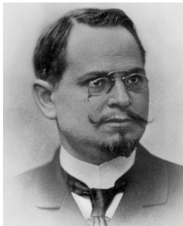
Figura 9. Alois Riegl (1858 –1905)

Historiador del arte austriaco, graduado en la Universidad de Viena y miembro de la “Escuela de Historia del Arte de Viena” (Ver figura 9). Riegl debe su fama sobre todo gracias a las teorías que ven en la “voluntad artística” ( Kunstwollen ), o sea, el factor central la producción de una artista que va relacionada con el “estilo”. Además, fue ejemplar al esclarecer la forma en que el espectador de una obra de arte se involucra en un proceso mental y creativo llamado “la parte del observador” (Iversen, 2003).