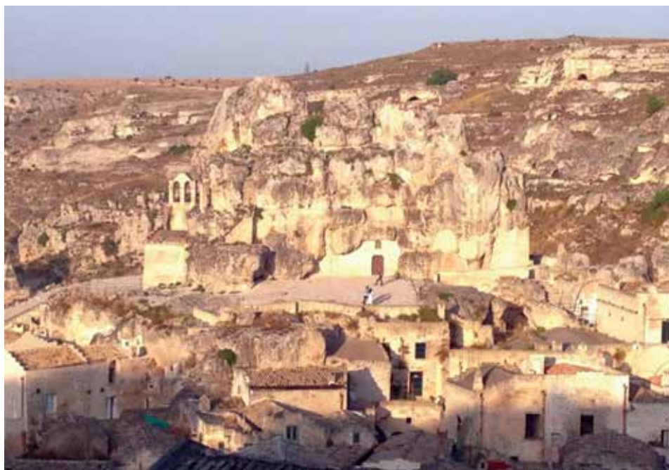
Figura 18. La iglesia de Santa Maria de Idris, ubicada en un promontorio de Monterrone, un gran acantilado de piedra caliza que se eleva en medio de Sasso Caveoso.

Al proseguir el recorrido, se divisa la iglesia de Santa Maria de Idris, se llega por un tramo de escaleras cerca de la iglesia de piedra de Santa Lucia alle Malve. El nombre Idris deriva del griego digitria, el que muestra el camino, o del agua que brotó de esa roca (figura 18).