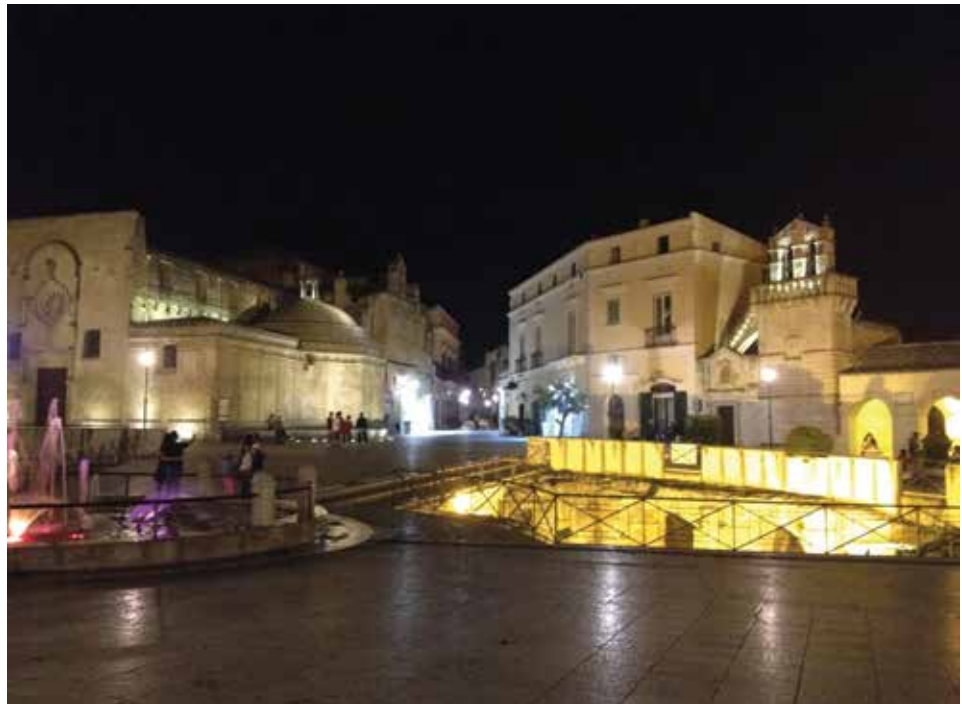
Figura 4. Panorámica de la Plaza Vittorio. Se parece en el subsuelo del ingreso al “Palombaro Lungo”, increíble trabajo hidráulico que garantizó el suministro de agua a la ciudad, la cisterna más grande del mundo excavada sin ayuda de maquinaria.

Regresando a la historia de Matera, Gianatelli (2011) narra cómo después del neolítico prosiguen a lo largo del tiempo una serie de transformaciones que confluyen en el hábitat de la civilización rupestre (siglos IX-XI), que constituye el sustrato urbano de los Sassi, con