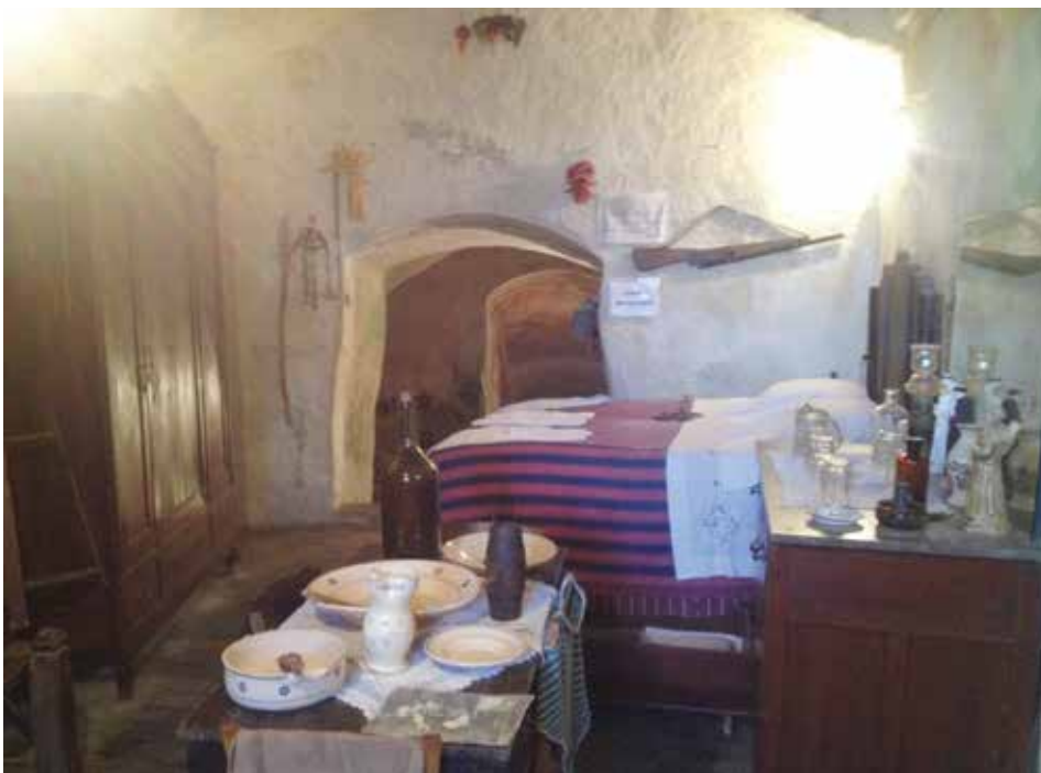
Figura 16. Habitación principal de la Casa Gruta.

Aunque presenta vestigios de viviendas, a lo largo de los siglos estas se han utilizado cada vez más como bodegas para la producción y conservación del vino. Sin embargo, es posible visitar antiguas casas reconstruidas como la Casa Gruta, morada típica excavada en la roca y decorada con muebles y herramientas antiguas para comprender mejor las costumbres y hábitos de los habitantes de los antiguos distritos Sassi, de inicios del siglo XX (figura 16).