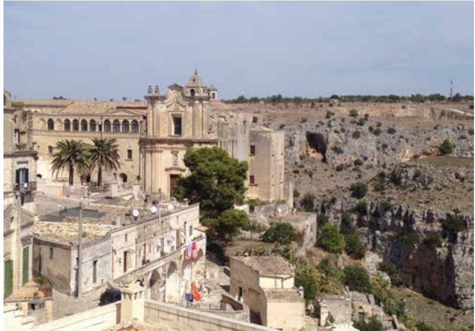
Figura 13. El complejo de Sant'Agostino, formado por la iglesia y el convento, es un edificio de culto que data de finales del siglo XVI, ubicado en la ciudad de Matera, precisamente en los distritos Sassi, al lado del Barranco de Matera.

Pasos más allá, se encuentra la Iglesia de San Agustín y su adyacente monasterio, construido en 1500 y ampliado en 1658. Fue sede del Capítulo General de la Orden de los Agustinos y luego cuartel de las tropas piemontesas, vivienda para personas desplazadas y refugio para los ancianos. La iglesia del siglo XV-XVIII se ubica sobre el borde de la Gravina y ha sufrido alteraciones en su fachada original, la cual hoy en día presenta un estilo barroco (figura 13).