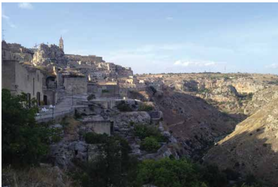
Figura 2. El barranco de Matera.

La historia de Matera está estrechamente ligada a sus inigualables “Sassi” de Matera. La palabra “sassi” traduce literalmente del italiano al español “piedras”, pero para el caso de Matera son simplemente el nombre de dos distritos, el Sasso Caveoso y el Sasso Barisano, formados por edificios de piedra construidos en las canteras naturales de los relieves montañosos de baja altura del área, comúnmente conocido con el nombre italiano de “Murgia Materana”, lugares habitados desde el período paleolítico. En otras palabras, un asentamiento urbano en zonas rocosas derivado de las diversas formas de civilización y antropización que se han sucedido a lo largo del tiempo. Los historiadores señalan como punto de partida el Neolítico cuando aparecen las aldeas atrincheradas (Caracciolo, 2014). Según los historiadores, la elección de este sitio se debe a que el entorno garantizaba una seguridad extrema para la ciudad, aunque esta prioridad implicó enormes dificultades para el abastecimiento de agua de los habitantes. De hecho, Matera es un pueblo nacido entre las rocas, por lo que sus Sassi se ubican sobre lo que los geólogos llaman “calcarenitas”, comúnmente conocido por la gente del pueblo como “tufo”, o sea, toba volcánica (Neuendorf et al., 2005), característica de las regiones Basilicata y Apulia), la cual ha sido trabajada por los maestros artesanos de esta tierra, quienes la aprendieron a utilizar desde tiempos inmemorables.