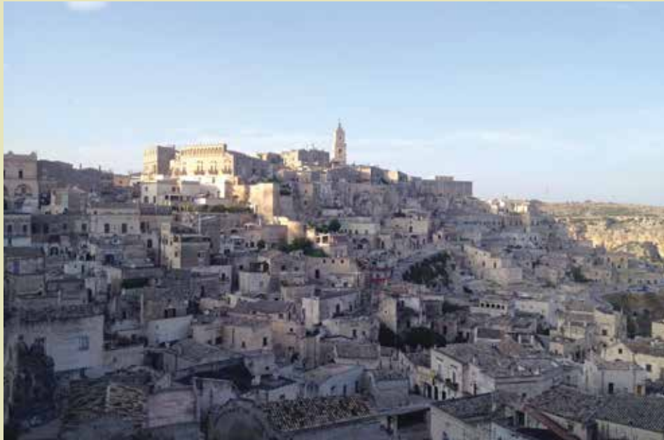
El Sasso Barisano de Matera con la catedral en la parte más alta. Fuente: Carlos Gómez Arciniegas.