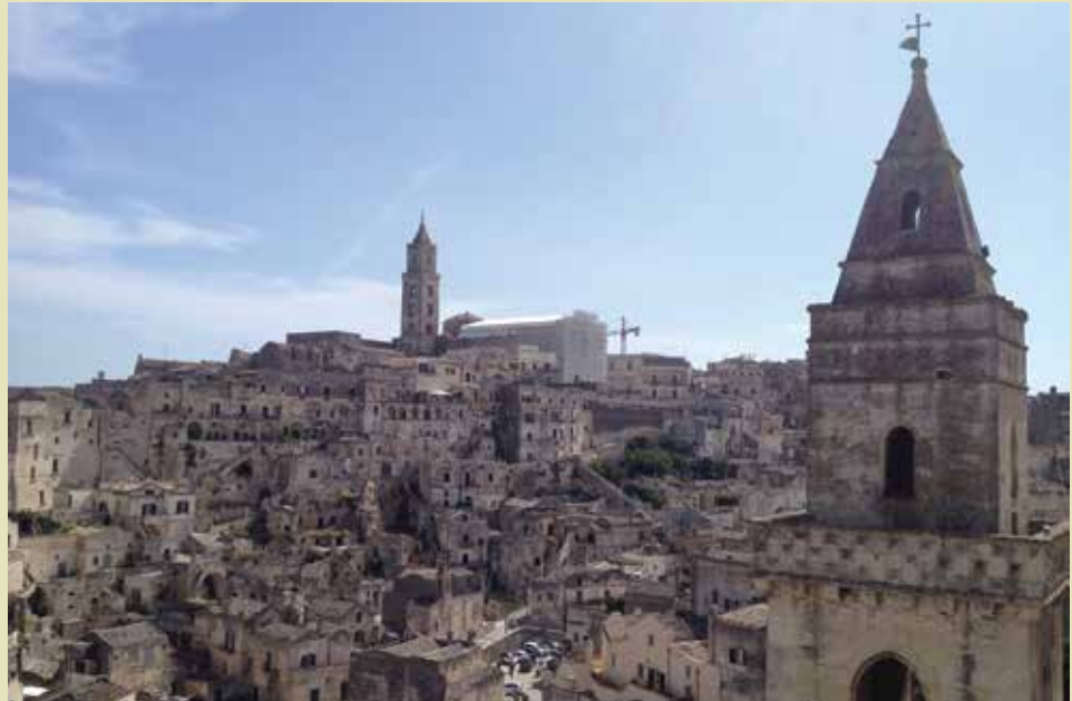
Panorámica del Sasso Barisano de Matera.

DOI: https://doi.org/10.15332/rev.m.v16i0.2476