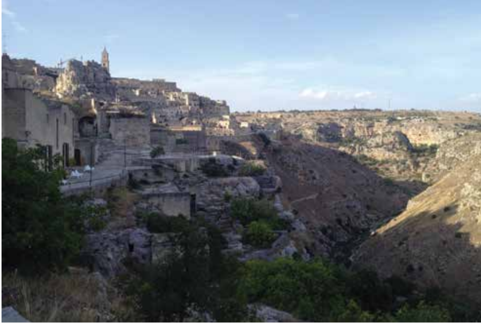
Figura 15. Vista parcial del Sasso Caveoso. Al fondo, en lo alto, el campanario de la Catedral.

El Sasso Caveoso es el barrio que está principalmente excavado en la roca. El origen del nombre podría de hecho derivarse del latín “caveosus”, es decir, con muchas cuevas, o del hecho de que su particular forma de anfiteatro recuerda la cávea romana (figura 14).