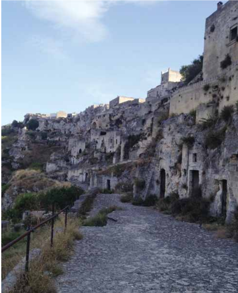
Figura 19. Vetusta calle del Sasso Caveoso.

A pesar del avanzado deterioro de las construcciones y de muchas de sus vías, el Sasso Caveoso ofrece un paisaje sugestivo que evoca asentamientos del medio oriente por lo que esta zona ha servido como locación para famosas películas.