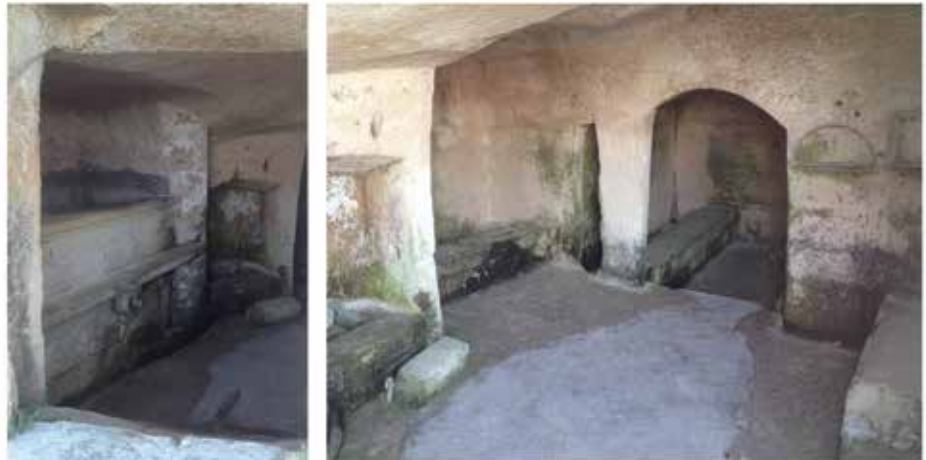
Figura 3. Sistemas de Canalización de agua en el Sasso Caveoso.

Los Sassi se ubican sobre una elevación a unos 150 metros sobre el nivel de un pequeño curso de agua, comúnmente conocido como “el barranco de Matera”, mientras que las colinas de arcilla que los rodean al oeste están demasiado lejos para asegurar el suministro de agua en caso de asedios (figura 2). A pesar de esto, perpetuando un uso documentable desde las fases neolíticas, los habitantes han explotado en su propio beneficio la friabilidad de la roca y las laderas para crear un complejo sistema de canalización del agua, conducida en diferentes momentos históricos a través de una amplia red de cisternas y “palombari” que aún se pueden apreciar en cualquiera de los Sassi (figura 3) e inclusive en los límites con la ciudad moderna, en Plaza Vittorio Veneto (figura 4).