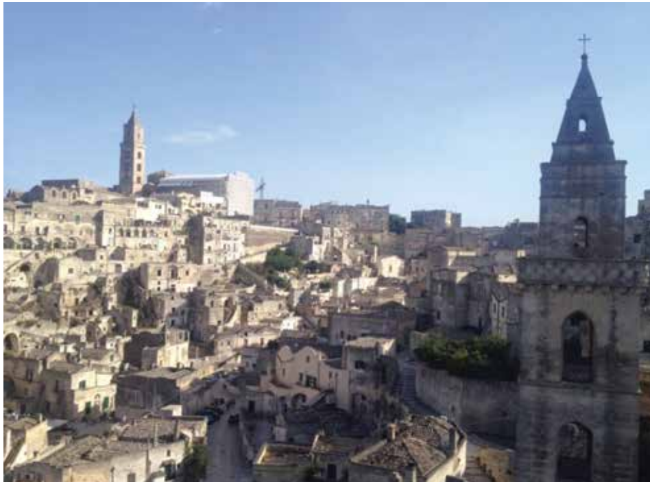
Figura 11. Los campanarios del Duomo y de San Pietro Barisano, la más grande iglesia rupestre de la ciudad, son hitos de Matera.

La recuperación de los Sassi comenzó precisamente desde aquí y hoy es el distrito (barrio) más restaurado. Registra una alta presencia de hoteles y restaurantes en comparación con el Sasso Caveoso y la Civita. En el barrio Sasso Barisano sobresalen construcciones como la Iglesia de San Pietro Barisano, que data de los siglos XVI al XVII. La iglesia tiene una fachada en mampostería y está completamente excavada en su interior. Al lado se alza el campanario cuadrangular de varios pisos que termina con una cúspide. El interior, iluminado por un particular rosetón de cuatro lóbulos, tiene tres puertas que conducen respectivamente a las tres naves (figuras 12 y 13).