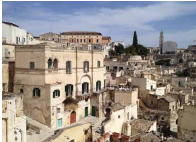
Figura 10. El Sasso Barisano, con el campanil del Duomo al fondo.