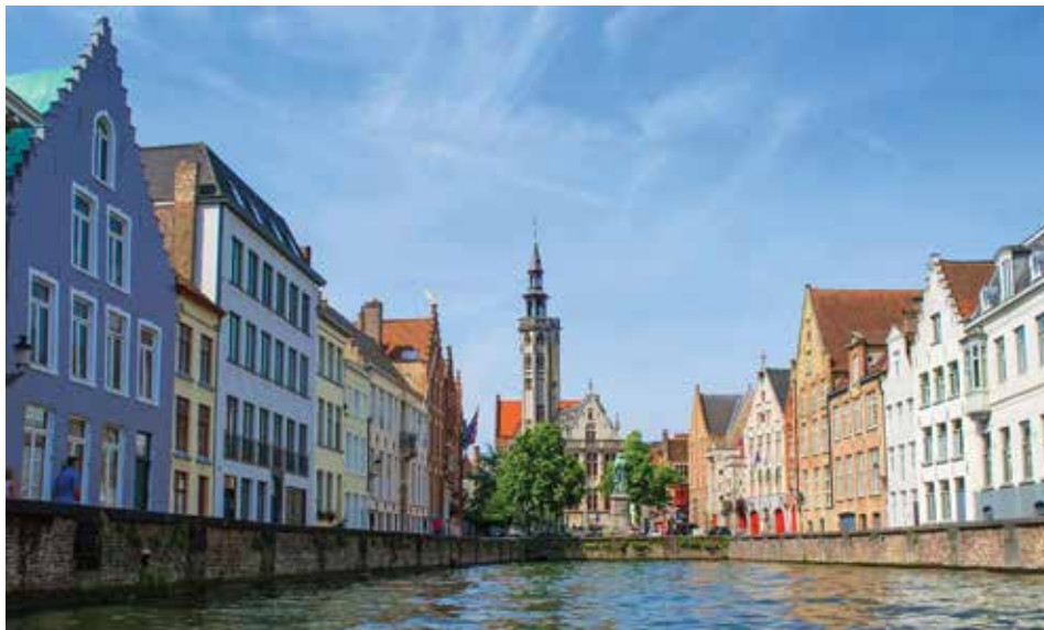
Figura 1. Brujas, Capital Europea de la Cultura 2002.

Los ejemplos son numerosos, pero bien se puede traer a colación el renombre adquirido por la ciudad belga de Brujas, Capital Europea de la Cultura en 2002, la cual mostró al mundo un patrimonio urbano y arquitectónico de singular belleza distribuido a lo largo de sus canales, los que la hacen rival de Venecia en Italia (figura 1).