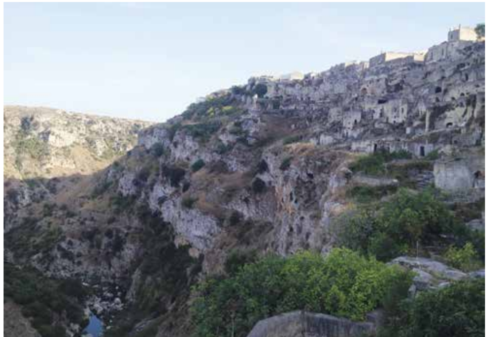
Figura 14. Vista del desfiladero sobre el cual se ubica el Sasso Caveoso.

Después de caminar por el Sasso Barisano, al sur de la Civita, se encuentra el Sasso Caveoso, bordeado por Via Madonna delle Virtù desde la cual se aprecia el barranco con el curso de agua llamado “Torrente Gravina”.