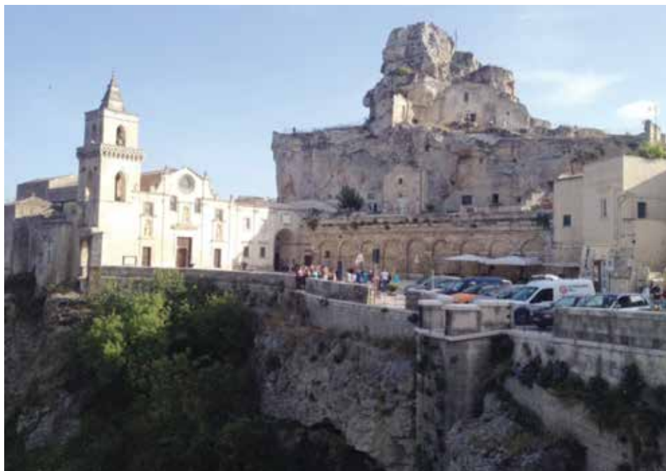
Figura 17. La iglesia de los Santos Pedro y Pablo, popularmente conocida como la iglesia de San Pietro Caveoso.

Sobresale también en el barrio de Sasso Caveoso la iglesia de San Pietro Caveoso, ubicada en la plaza homónima que domina el barranco, construida entre los siglos XIII y XIV. De la planta original permanece poco, ya que ha sido distorsionada progresivamente por los trabajos de reconstrucción en varias épocas. La fachada tiene motivos arquitectónicos que recuerdan tanto el barroco como el románico (figura 17).