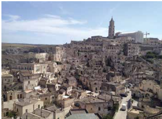
Figura 9. El Sasso Barisano, abigarrado de antiguas viviendas.

Los distritos de Matera, más conocidos como Sassi son sello inconfundible de la ciudad y le aportan una gran singularidad a su centro histórico. Fueron excavados y construidos en la Gravina di Matera, un profundo desfiladero que divide el territorio en dos. Un paseo por los Sassi de Matera deja bien en claro cómo estos distritos se posicionan sobre dos pequeños valles que miran hacia el este, levemente deprimidos con respecto a los territorios circunstantes, separados unos de otros por el montículo rocoso de la Civita. Desde la ciudad nueva es más fácil acceder al Sasso Barisano, el cual gira al noroeste en el borde del acantilado, si se toma como referencia la Civita, núcleo de la ciudad antiguo. Innumerables elementos son un misterio en el Sasso Barisano e incluso aquí el origen de su nombre es incierto. Sus habitantes lo atribuyen a su orientación hacia la ciudad de Bari o a la antigua presencia de la familia romana Varisius, de la cual Varisianus y luego Barisano. En cualquier caso, es un distrito de incommensurable valor histórico, rico en portales esculpidos, frisos y pinturas que se ocultan en sus subterráneos. Asimismo, es el más rico en construcciones, en apariencia, pues en realidad el interior de las casas está excavado en la roca (figuras 9 y 10). Está atravesado por Via D'Addozio, pero su eje principal es Via Fiorentini, que, como Via Bruno Buozzi, se encuentra en un antiguo "grabiglione".