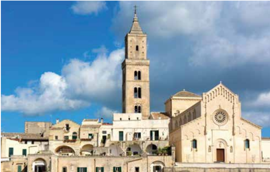
Figura 7. La catedral (Duomo) de Matera.

en la Civita que dejan en claro la presencia de un importante asentamiento humano en este sector desde el siglo IX a. C. En los últimos años se han implementado obras de revitalización urbana en la Civita para 2019, dado que algunos edificios en esta área acusan un notable estado de abandono. A pesar de esto, la Civita es un área caracterizada por notables edificios que compiten con la belleza de la imponente catedral (Duomo) y que parecen doblegar a las vetustas construcciones que la rodeaban (figura 7). La catedral se observa desde muchos ángulos de Matera y se accede a ella por su fachada principal y por uno de sus costados, ya que el edificio se posiciona caprichosamente sobre la Plaza de la Catedral (Piazza Duomo). Muy cerca se encuentra la Piazza del Sedile, destacado punto de encuentro en la Civita por estar ubicado en una posición estratégica entre Piazza Vittorio Veneto y Piazza Duomo. Allí se puede llegar por dos caminos que se unen en ella: Via San Francesco y Via delle Beccherie (figura 8).