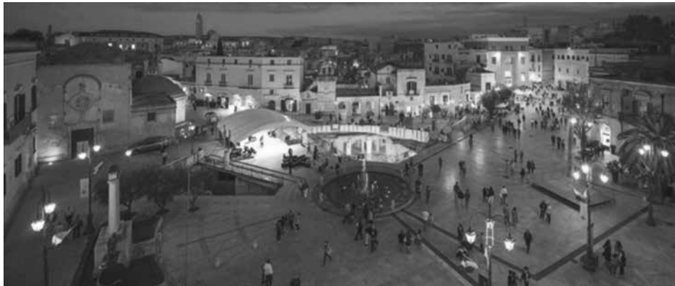
Figura 5. La plaza de Vittorio Veneto punto de unión entre la Matera antigua y la moderna.

Matera no son solo los Sassi y su famoso conjunto de iglesias rupestres, reconocidos el 9 de diciembre de 1993 en la Asamblea de Cartagena de Indias (Colombia), Patrimonio de la Humanidad por la UNESCO, que aunque si bien le imprimen un carácter sin igual en términos de patrimonio inmueble no constituyen los únicos elementos que le dan vida a esta ciudad, una de las ciudades. La Matera de hoy es una ciudad italiana con más de 60.000 habitantes, capital de la provincia homónima y la segunda ciudad de la Región Basilicata por población, así como el municipio más grande por su superficie. La ciudad antigua y la ciudad moderna conviven hoy en día en armonía y se denota muy bien que ambas comulgan en reciprocidad, fusionándose en armonía y a través de nodos característicos como lo es Piazza Vittorio Veneto, que sirve de fulcro entre lo antiguo y lo nuevo (figura 5). La Matera moderna es un centro urbano con interesantes edificaciones de estilo moderno y contemporáneo que bordean sus transitadas vías. Existen atractivas zonas comerciales y el sector terciario está bien consolidado. La ciudad está servida por una notable red vehicular