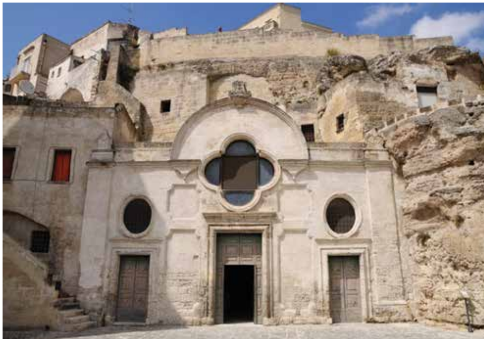
Figura 12. La Iglesia de San Pietro Barisano.

La recuperación de los Sassi comenzó precisamente desde aquí y hoy es el distrito (barrio) más restaurado. Registra una alta presencia de hoteles y restaurantes en comparación con el Sasso Caveoso y la Civita. En el barrio Sasso Barisano sobresalen construcciones como la Iglesia de San Pietro Barisano, que data de los siglos XVI al XVII. La iglesia tiene una fachada en mampostería y está completamente excavada en su interior. Al lado se alza el campanario cuadrangular de varios pisos que termina con una cúspide. El interior, iluminado por un particular rosetón de cuatro lóbulos, tiene tres puertas que conducen respectivamente a las tres naves (figuras 12 y 13).