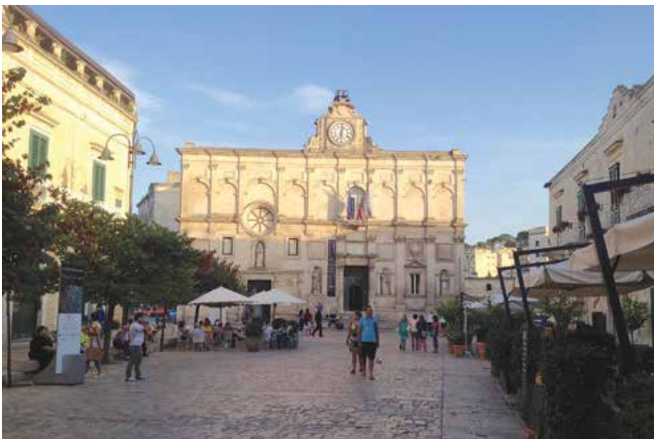
Figura 8. Plaza del Sedile, situada entre la Piazza Vittorio Veneto y la Plaza de la Catedral (Duomo).