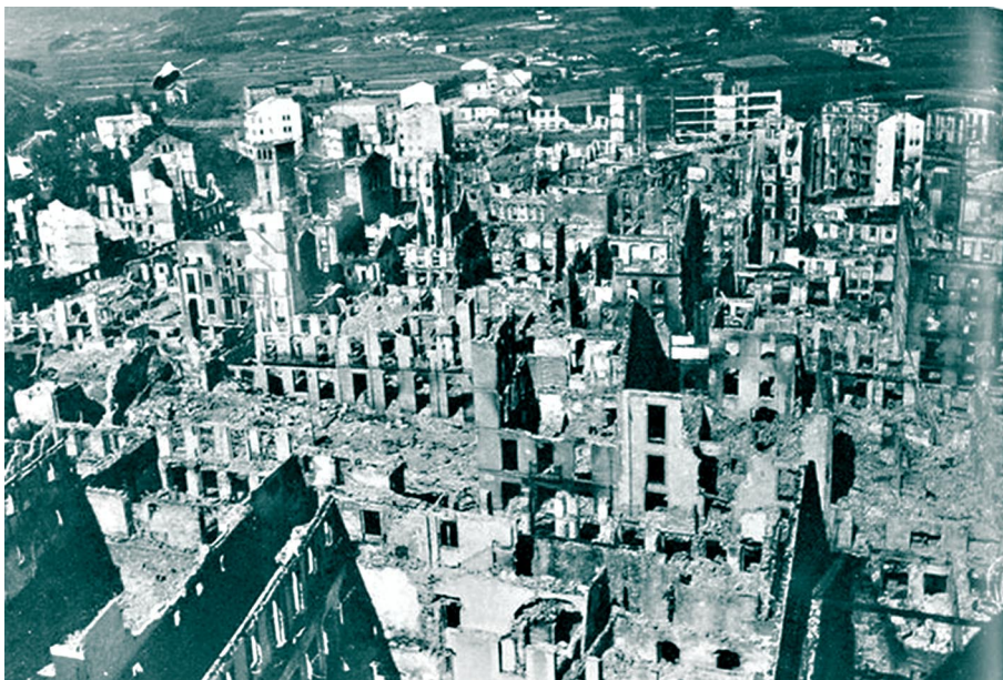
Guernika, España, 1937

Voy a plantear la imagen de la destrucción de las ciudades, vivida de nuevo de forma absolutamente radical por Europa en la segunda guerra llamada mundial. La guerra de 1939 a 1945. La técnica de destrucción del bombardeo aéreo ya se había entrenado en Europa en la primera guerra de 1914, en bombardeos parciales sobre ciudades. La guerra civil española, entre 1936 y 1939, sirvió de ensayo general a los bombardeos que sucedieron en la segunda guerra europea. La guerra de España significó en muchos sentidos el experimento y el presagio de ese horizonte de devastación que sucedió en toda Europa. La crueldad del bombardeo aéreo de la ciudad de Guernika, el 26 de Abril de 1937, fue una visión casi profética, un Apocalipsis en sentido literal que anunciaba el rasgado paisaje de la inmediata crisis bélica.