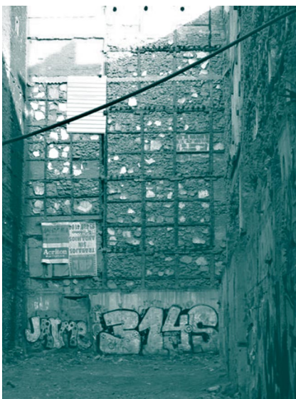
Graffiti, Madrid marzo de 2007

Esta dualidad o diálogo entre lo programado y lo espontáneo, entre lo que se muestra y lo que permanece en forma más oculta dota de tensión al espacio habitado. Tensión que es también riqueza de sentido, grosor de significación. Algo que sucede de forma excepcional en las construcciones de edificios sagrados, destinados a cultos y rituales que, aún cesados sus usos y substituidas por otras, determinan las construcciones sucesivas. Una capacidad de registrar la memoria del tiempo que en otro tipo de edificaciones puede producirse de modo diverso, como sucede en las casas que habitamos los ciudadanos comunes. Las casas vividas, las casas de la vida, parafraseando a Mario Pratz, suponen un bello ejemplo de la capacidad de los espacios por mantener la memoria. Aún cuando los signos de nuestra propia vida tiendan a borrar los signos de anteriores ocupaciones, si las hubo, la propia experiencia de habitar en el ciclo de cada existencia, crea en las casas