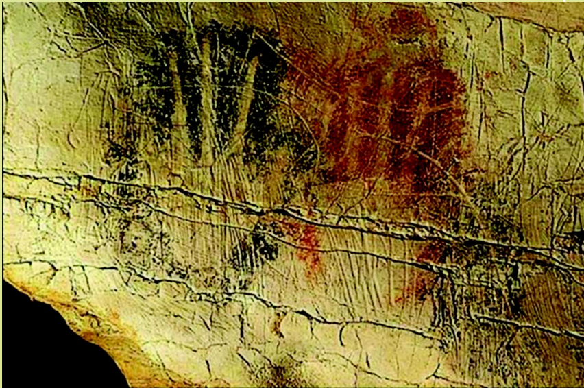
Cueva de Roucadour Perigordienne 20.000 - 30.000 años

*Doctora Arquitecta, Escuela Técnica Superior de Arquitectura Universidad Politécnica de Cataluña.