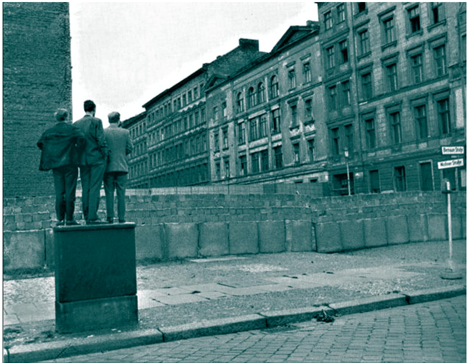
Berlín, foto de Henri Cartier-Bresson, 1962

ellos, los difíciles caminos de la ciudad reconstruidos por los pasos de los ciudadanos, empeñados en sobrevivir entre escombros: esas son sus escenas. Un tejido de realidad y ficción que construye un documento de amor y dolor. La larga toma final en que seguimos al niño que juega entre las ruinas representa también el final de una tragedia. Los destrozados espacios de la arquitectura se convierten por la acción infantil en ejercicio de acrobática inocencia. La distancia entre arquitectura y humanidad se estrecha hasta desgarrarse en un último salto en el vacío que supone la muerte del protagonista. La ciudad muestra su verdadero ser, hecho de materia y experiencia.