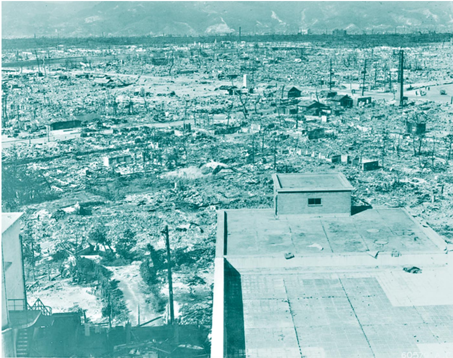
Hiroshima, después de la primera bomba atómica

Es muy difícil mantener un compromiso con la memoria del dolor en el orden de lo monumental, pero es muy difícil borrar sus verdaderas huellas, pues incluso en los aparentes simulacros de ciudades fielmente reconstruidas se infiltra la realidad de la memoria, precisamente por el llamativo esfuerzo de borrarla. Del mismo modo que el silencio en las sociedades, en las familias, la incapacidad de articular relatos en síndromes postraumáticos no borra la memoria, no representa verdaderas formas de olvido, sino que subraya, por su extrañeza, la verdadera memoria del miedo y del dolor.