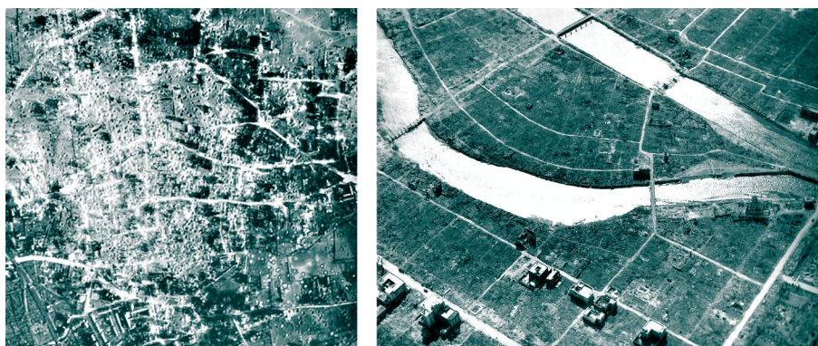
Düren, 1945 - Hiroshima, 1945

La fotografía permite que contemplemos la impactante huella de la devastación. Pero las sociedades y los estados europeos y de todo el mundo se empeñaron, sobre todo, en la reconstrucción. Es el silencio lo que suele suceder a la guerra. Y en correspondencia, las formas de la arquitectura que suceden a los escenarios de la aniquilación acostumbran a constituirse como máscaras, a rebuscar esas máscaras en las imágenes del pasado destruido, para devolverlas a la ciudad que las ha perdido. En las imágenes de la destrucción, son de nuevo las trazas los signos más visibles de lo que fueron las ciudades devastadas. Las trazas permanecen sobre solares en diferentes niveles de destrucción. Las montañas de escombros parecen representar la vuelta a una geografía virgen, pero su observación más precisa indica cómo el material de desecho guarda memoria de la vida: aún en esas topografías de la destrucción se pueden contemplar los objetos y útiles que acompañan la vida cotidiana, desde dentro de las casas. La huella de la vida es casi imposible de borrar. En toda reconstrucción forzada de un pasado destruido, por el contrario, se adivina de algún modo la falsificación y planea sobre ella la sombra de la muerte.