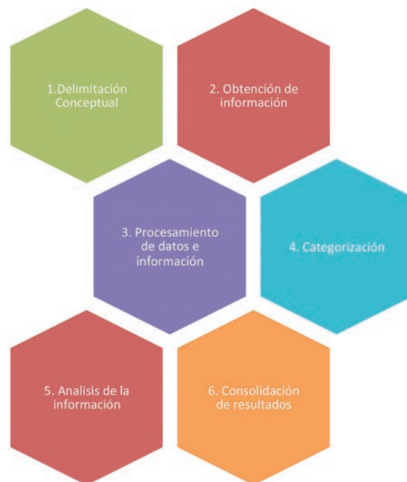
Esquema 1. Diseño Metodológico

planteamientos teóricos de algunos autores al respecto. Las fases mediante las cuales se adelantó este estudio fueron las siguientes: