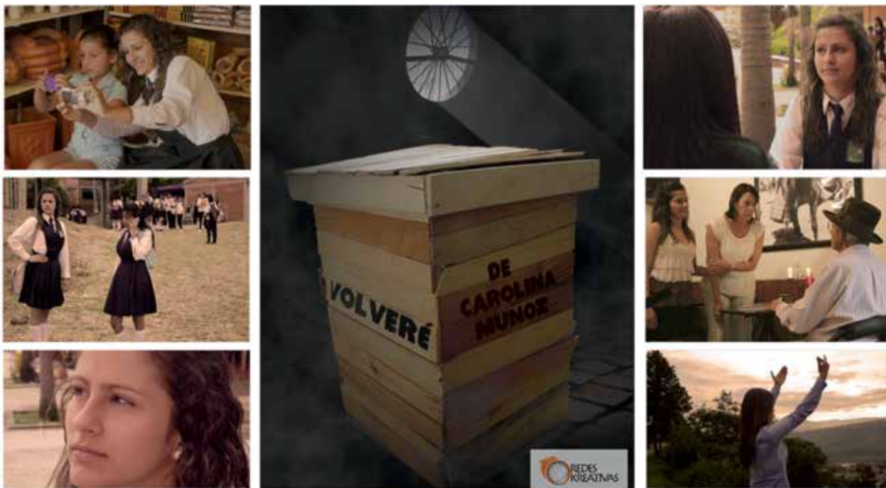
Afiche publicitario de la película.