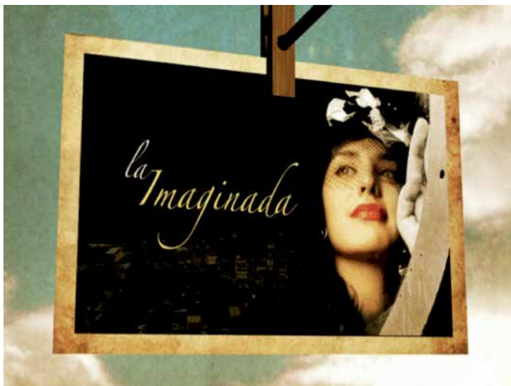
Carátula de la película

Es un cortometraje ficcionado, realizado en el 2011, que estuvo nominado a los Premios India Catalina 2012.